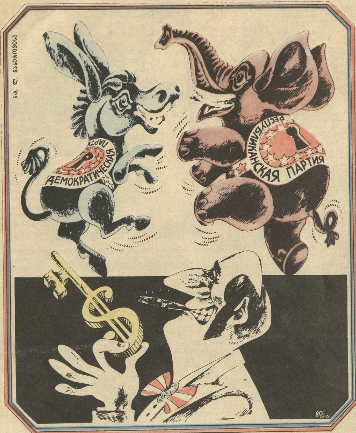
მოსამართავი თოჯინები და ქია სემის ერთი ოქროს გასაღები