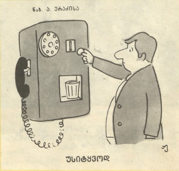
ნახ. ა. პარაძისა

ყველა არამზადმ ერთხელ და სამუდამოდ უნდა შეიგნოს რომ ჩვენ აღარ ვხუმრობთ! აქ მხოლოდ წერილის ავტორი იგულისხმება, რასაკვირველია!! (რედ.).