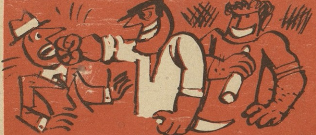
გამოსულხართ და დასდინართ, ენაობთ და ჩხუბსა სთესავთ!