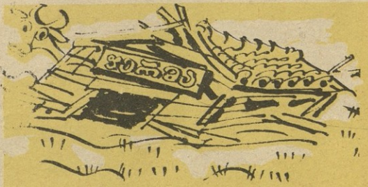
ვითარ აღშენდა, ისე დაიქცა.

ბარათი კარნახით ჩაიწერა ელგუჯა მერაბიშვილმა