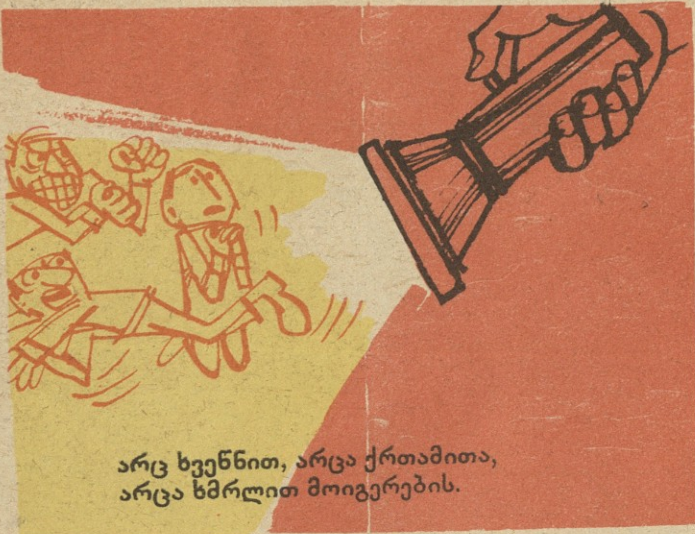
არც ხვენწით, არცა ქრთამითა, არცა ხმრლით მოიგერების.