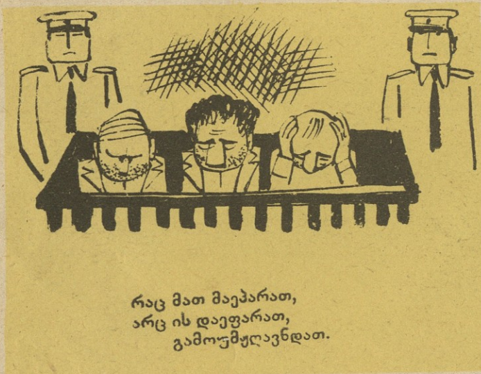
რაც მათ მეუბრათ, არც ის დაეფარათ, გამოუმუღვენდათ.