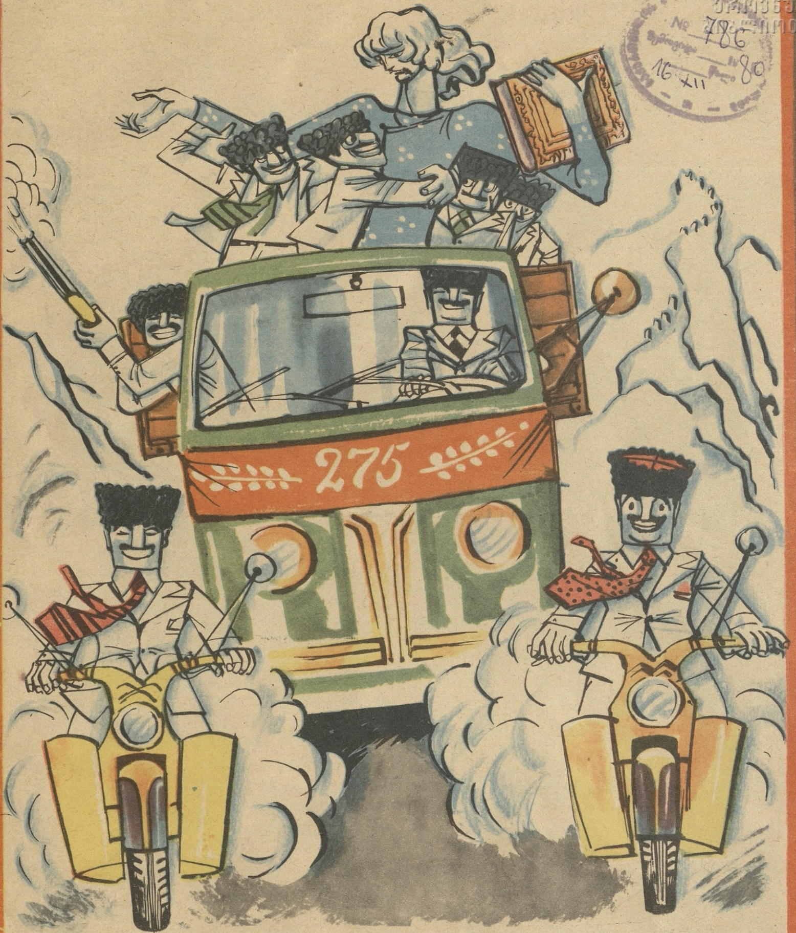
— ნუ გაგვიპაღიანდები, დავით ბატონო, და ახლა ქარის ორმო- ში ჩაგსვამთ: დაღესტნის ხალხთა ყველა ენაზე მთარგმნით და გა- მობცემით, კოოპერაციულ გინეთმშენებლოებაში შეგიყვანთ, „გაზ- 24“-ს გარუქებთ, რასულ გამგათოვსაც დაგამეგობრებთ!