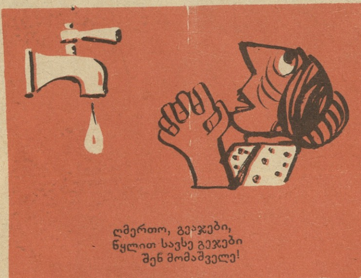
ღმერთო, გეაჯები, წყლით სახსე გეაჯები შენ მომაშველე!