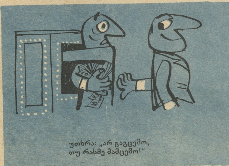
უთხრა: „არ გაგცემო, თუ რასმე მამცემო!“