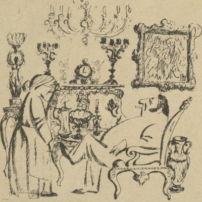
— რომ გამომხვადუნლარ ამ სახლში, მუხარამ ბინც დაბანყო! — მუხარამ რომ დაბინყო, ახმედ ქონებას ვინდა უხარარულყო!