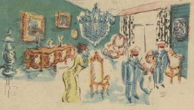
— ვაი, რა გოიჩ ნაიძეა, სახლ-ქარი თასხ დაბ- ვიძეაო!