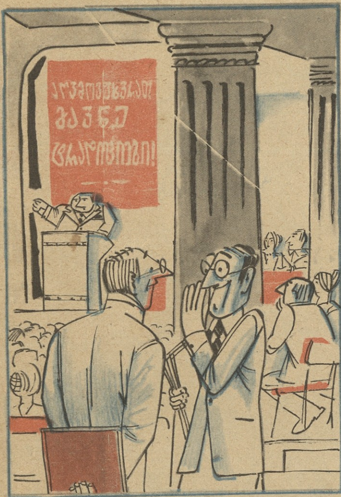
— ამ ლეჭორს ვერ დავენახვებ, გუშინ რვაასაპაციანი ქორწილიდან გავიქარა, თამადა იყო!