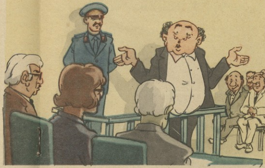
— თქმან ბრალად ბედაბათი თანადამბერის ბირობად გამოყენა- ბა! — შიშულბავალია მითულ ქალ-ღონს, ცოდნას და ენაობის ნათა- სავენიის და ნანერს-მამობრების კითრულღონისათვის ზრუნვას ვახმარდლი..