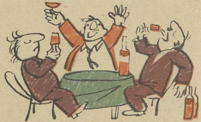
შეიბრალე თავი შენი, იცოდე! მეც შარბათში საწამლავს სვამ, იცოდე!