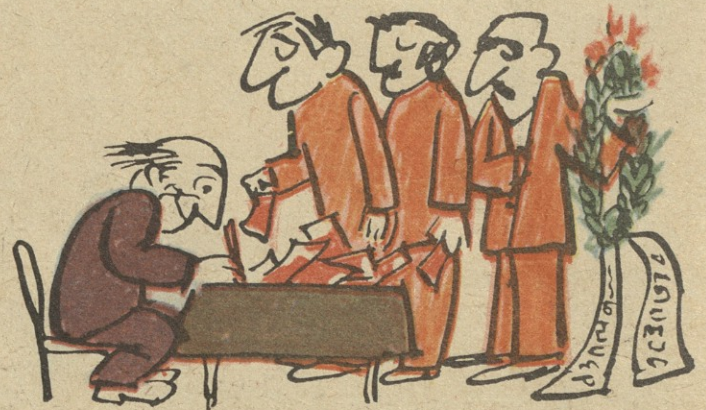
ჭირისუფალს მხოლოდ ცრემლი შეენისო! ეს სცინის... როგორ არა რცხვენისო?!