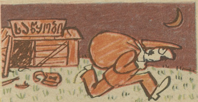
სხვა გზა არ მაქვს: მოპარუაა მხოლოდ ერთადერთი ღონე!..