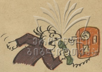
მაჰ, ოხ, ლმწირო, რად წავეკურო ჩვენ კაე ში არ შუგარო?