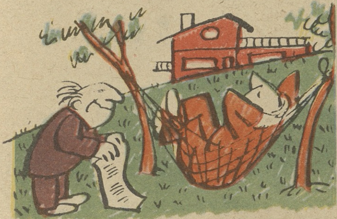
ახლა კი ვიცი, სადაც ხარ, სამეან გაქვს ბინა, სულივო!..