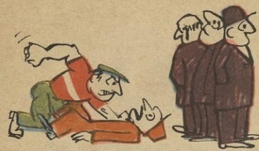
ითქის გეგავდა ეს ხალხი, უხმო, უნარავდ მდგარა.