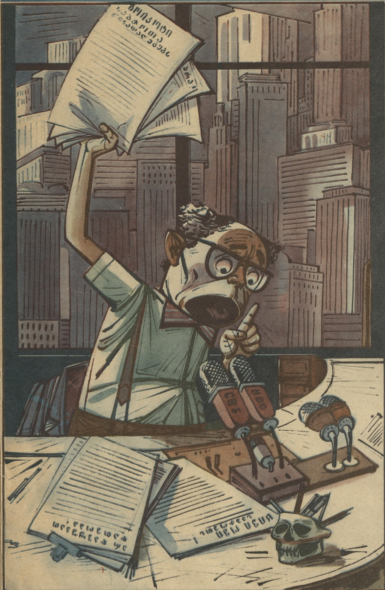
მისი ყევა მხოლოდ მარტო უჭრია!.. ვის აუზინებს ხანაცხილო მურიცა!

საბჭოთა კავშირის შურსაფრთხილ № 28 (1586), დეკემბერი გამოცემის 1923 წ. ივნისიდან.