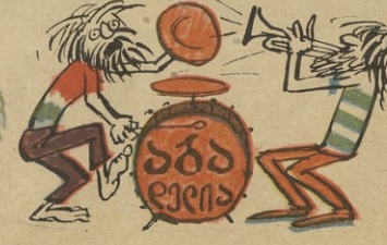
აღარც ერის არ გეყოლიდა ქართველობის რამ ნიშანი..