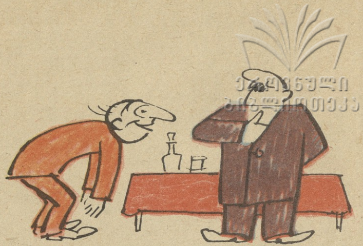
მე ვარ შენი ერთგული, სხვა მოგატყუებს ყველა!

მეტს არას გეტყვიო!.. რა საჭიროა მომეტებული სიტყვა და რჩევა?