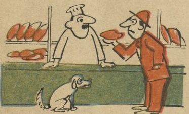
შენი გამოცხვარი პური — ღაგავი და მურახასი, აღმიანს არ ეკმევი, ღაუვარეთ მურახასაო!