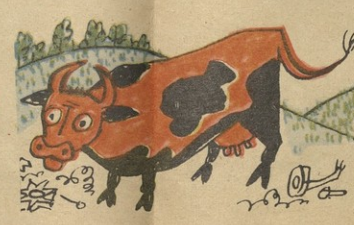
შენ ჩემი პირიკა შეინდაო, საკეპი აღარ გიბლიაო..