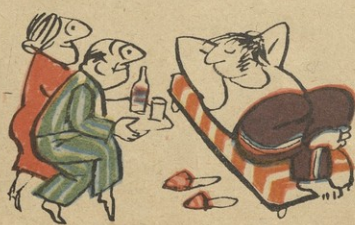
უფრო შარე და მწავიკა, როცა შინ ეკლავს შენი ფლიდაი..