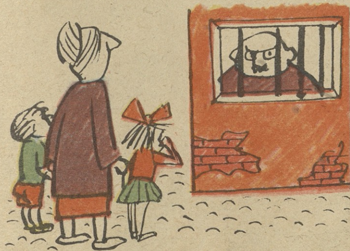
ეგ არის, რასაც ეძებდი, მორჩი და მოისვენეო!

ამას წინათ ბაზარს ვიყავ ნასული, ვნახე: ნადულს ფასი ედო ზღაპრული! „შემიღულდა მაშინ სული და გული; იმ ნადულში თვით მე ვიყავ დაგული“.