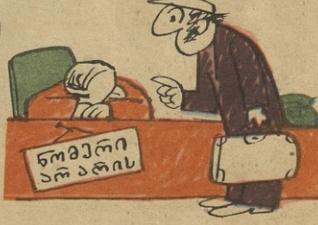
არ იციებებს, თუ უფულოდ მასთან მივიდა სტუმარი!