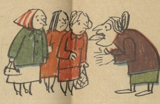
ნეტავ მამკნი, ამგვარ ჭორებს ხალ ტვიპობდეს? საიდან ჰკრებს?