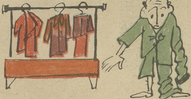
„ასჯერ გაზომეთ და ერთჯერ გამოსჭერთ!“ — ახლაც ვვფირი მე.