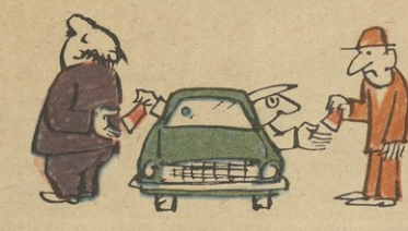
მარტო ჩვენთვის არ ვუშვამთ, სხვისაც ვუშვამთ სამსახურს!