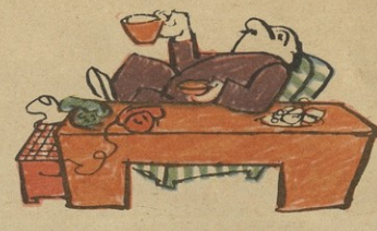
პურს კრავთ, როგორც რომ წინილი, კაცურ ღირსებს ღრნობდა ნელ-ნელა!