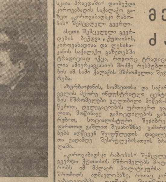
მეგობრები ერთმანეთისაგან სწავლობენ. მეგობრები ერთმანეთისაგან სწავლობენ. მეგობრები ერთმანეთისაგან სწავლობენ.