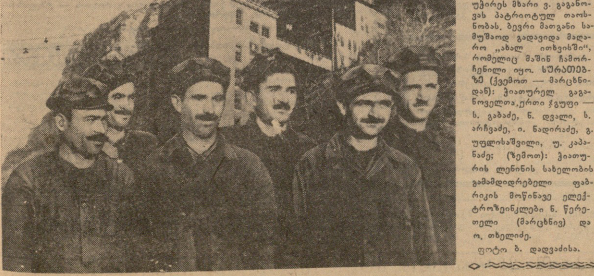
ქიათურელი მალაროელები მტკრეკებს და უბატაკებს...