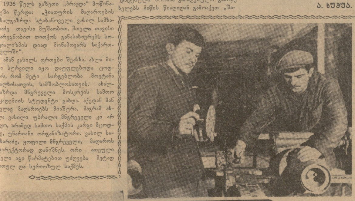
ქიათურელი მალაროელები მტკრეკებს და უბატაკებს...