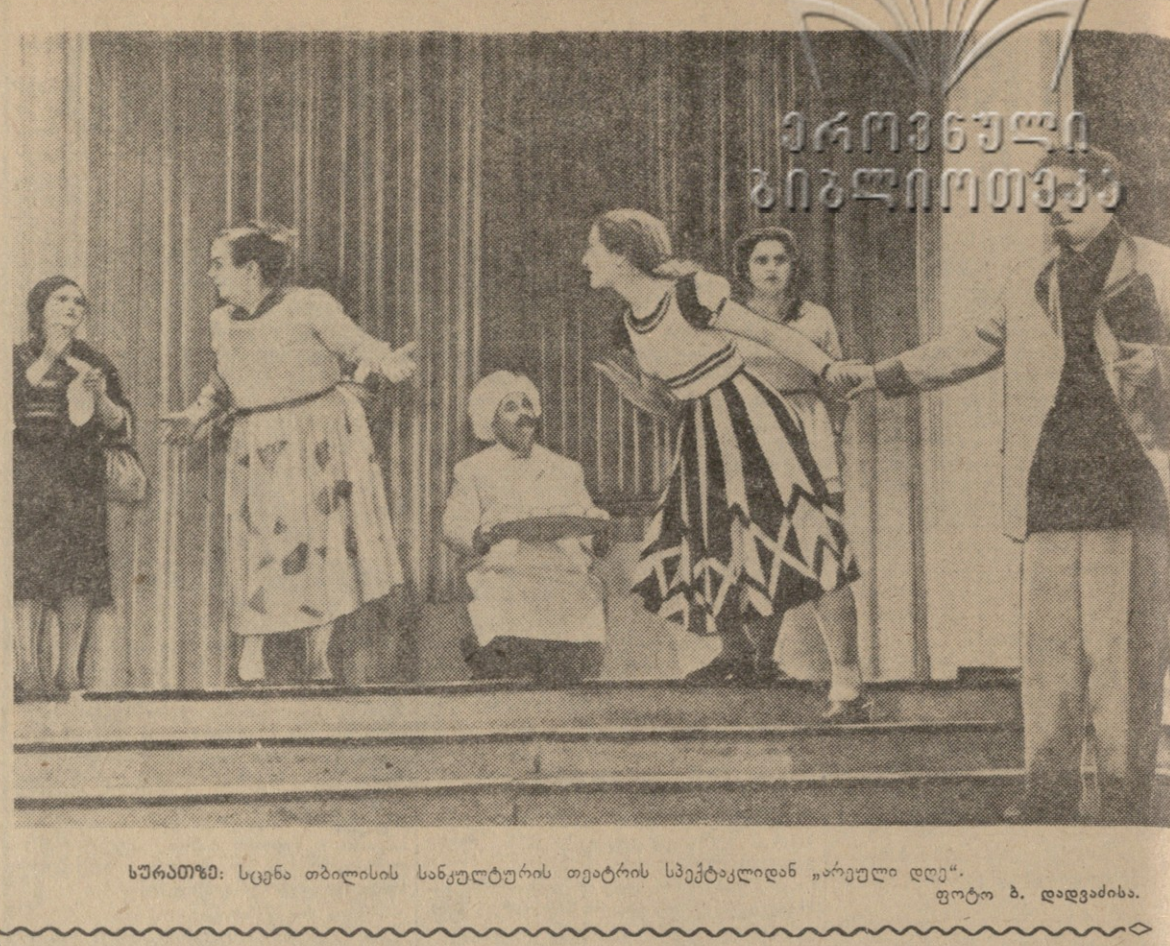
სწავლის სურათი: სცენა თბილისის სახელმწიფო თეატრის სპექტაკლიდან „არეოლი დე“.