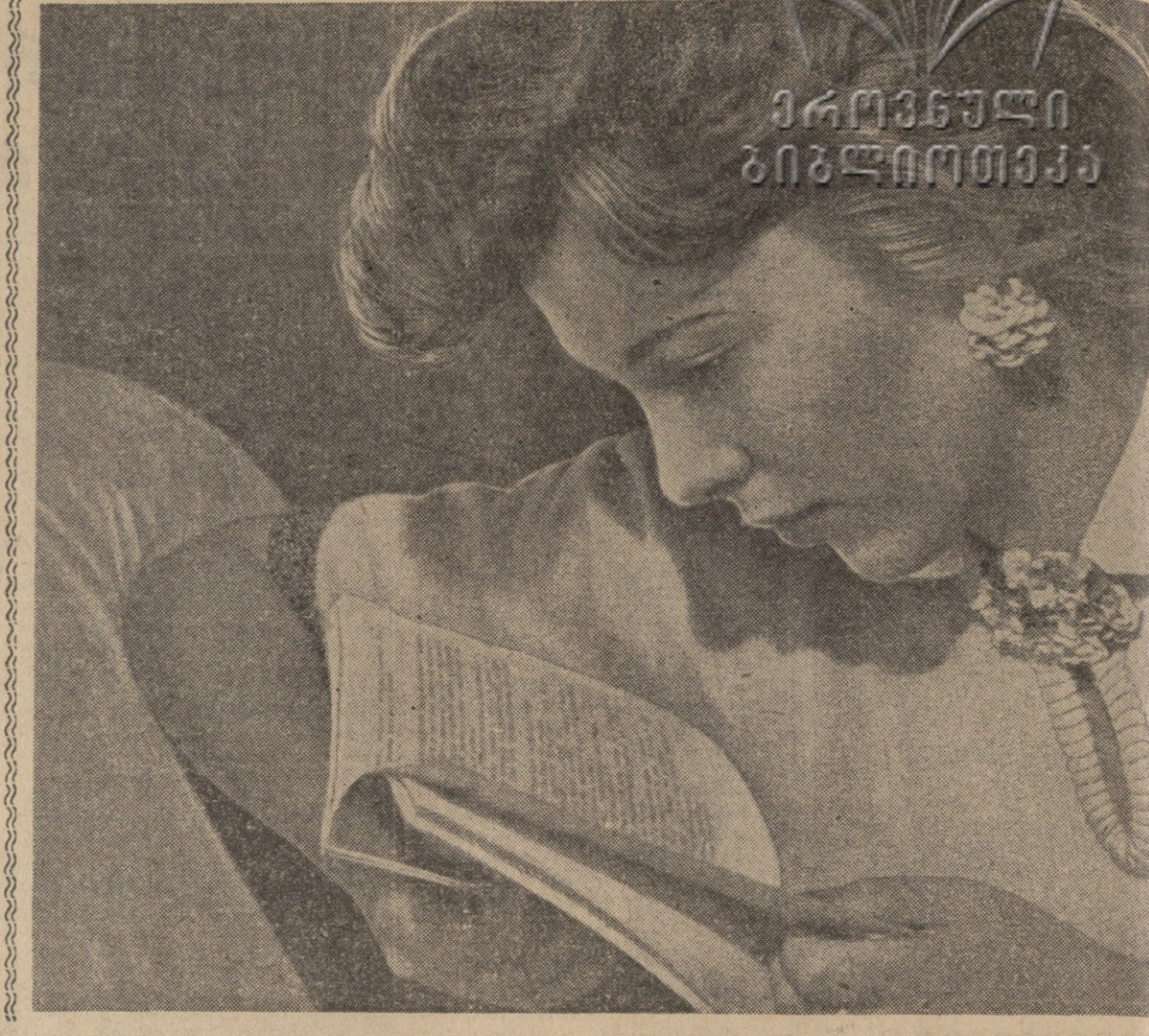
საბჭოთა დემოკრატია... საბჭოთა დემოკრატია...