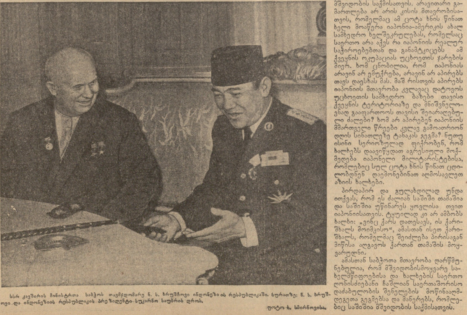
სსრ კავშირის მინისტრთა საბჭოს თავმჯდომარე ს. ხრუშჩოვი ინდონეზიის რესპუბლიკაში, სურათზე: ნ. ხრუშ-ჩოვი და ინდონეზიის რესპუბლიკის პრეზიდენტი-სუკარნო საუბრობენ დროს.

საყოველთაო და სრულ განმარტებულ შესაბამება უნდა სახელმწიფოსა და ხალხის ძირეული ინტერესებს, მათ შორის ეკონომიკურად სუსტდგანვითარებული ქვეყ-ნების ინტერესებს, რომელთაც მათ შეუძლიათ სულ უფ-რო მზარდი ეკონომიკური ღონისძიება მიიღონ იმ სასრუ-ბის ხარზე, რომლებიც განვითარდებიან განმარტებ-ბის შედეგად. ჩვენ ღონად ვართ დარწმუნებული, რომ განმარტების პრობლემის გადაჭრა კაცობრიობის დაუ-სახავს ახალ ერას — დედამიწაზე მტკიცე მშვიდობის ერას.