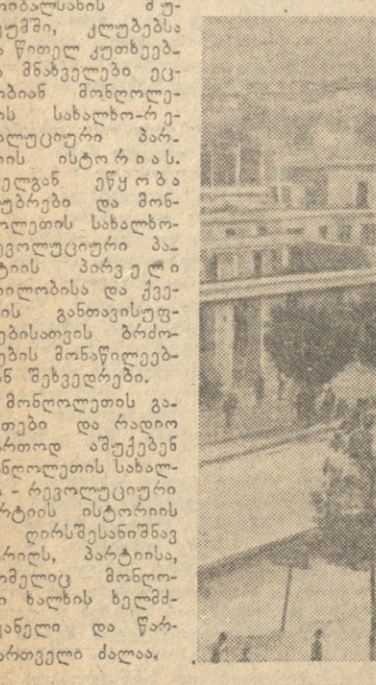
რედაქციისა და გამომცემლობის მისამართი: თბილისი, ლენინის ქ. № 14.

უღან-ბაბრძი, 1 მარტი. (საქდესი). დღეს მონღოლეთში აღინიშნება მონღოლეთის სახალხო-რევოლუციური პარტიის დასარსების 39 წლისთავი.