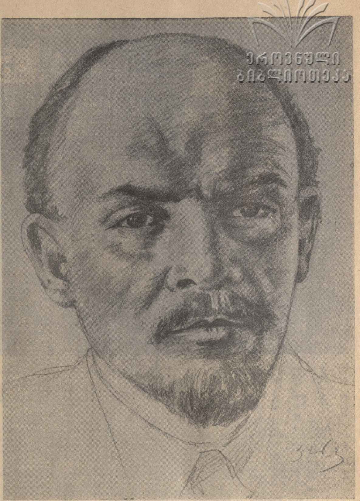
3. ი. ლენინი მხატვარი პ. სანაძე (ნახატი შესრულებულია ვახუთ კომუნისტისათვის)

ფრთავის დაყარების 40 წლისთავის ღირსეულად შეხვედრისათვის, ერთსულვად ვიწონებთ ამ ძვირფას თაოსნობის და ჩვენი მხრე ვისრულობთ: ფოლადის გამოღობის მიმდინარე წლის გეგმა შევასრულოთ 10 დეკემბრისათვის; 1961 წლის პირველი ორი თვის გეგმა — 25 თებერვლისათვის; 20 უკეთეს შემთხვევით დროში, მნიშვნელოვნად გავაძლიეროთ ლექსების გამოქობა; მეექვსე ავადმყოფი შრომის ნაყოფებზე, შევამტოვოთ პირველი პირველი თვითღებულ ბუღება და შეიქმნა რესპუბლიკური ფონდში შევიტანოთ 200