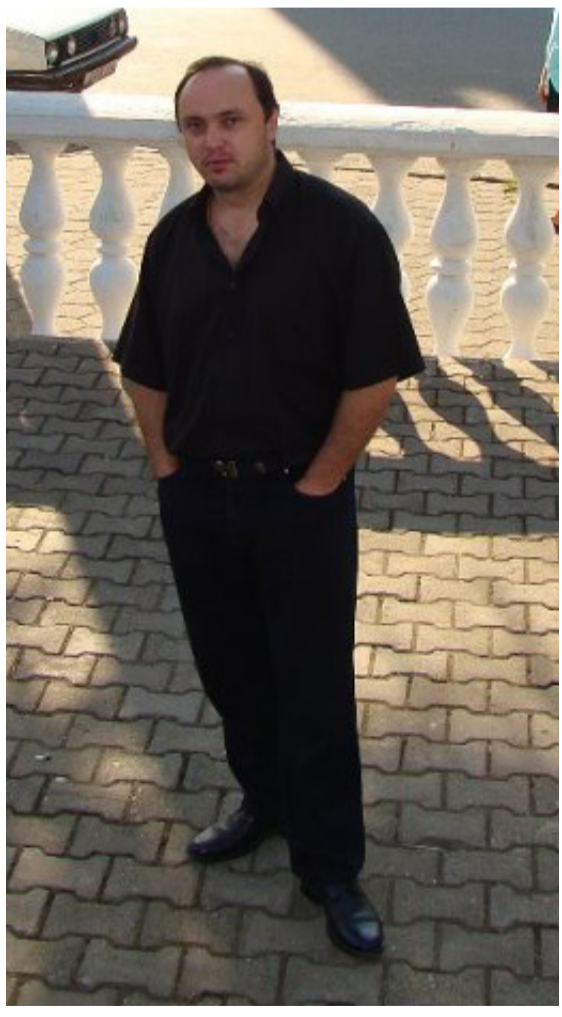
ვაჭარს სხვა მესხეთ ვაჭარზე

— მა, ასეთ ბებიახ სად ვნახავთ, ამდენი რამე იცოდეს? — სიცხიანი თვალები მომაპყრო