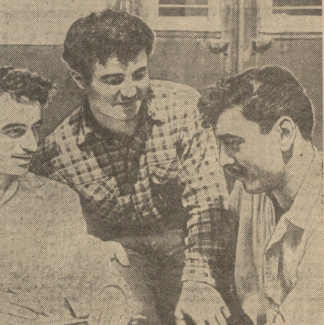
სურამიაში: თბილისის სტალინის სახელობის ორთქლმანქანების საწარმოს მუშაკები...