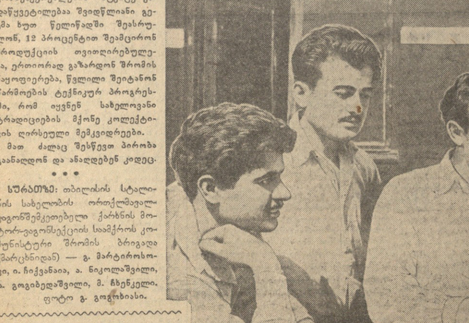
სურამიაში: თბილისის სტალინის სახელობის ორთქლმანქანების საწარმოს მუშაკები...