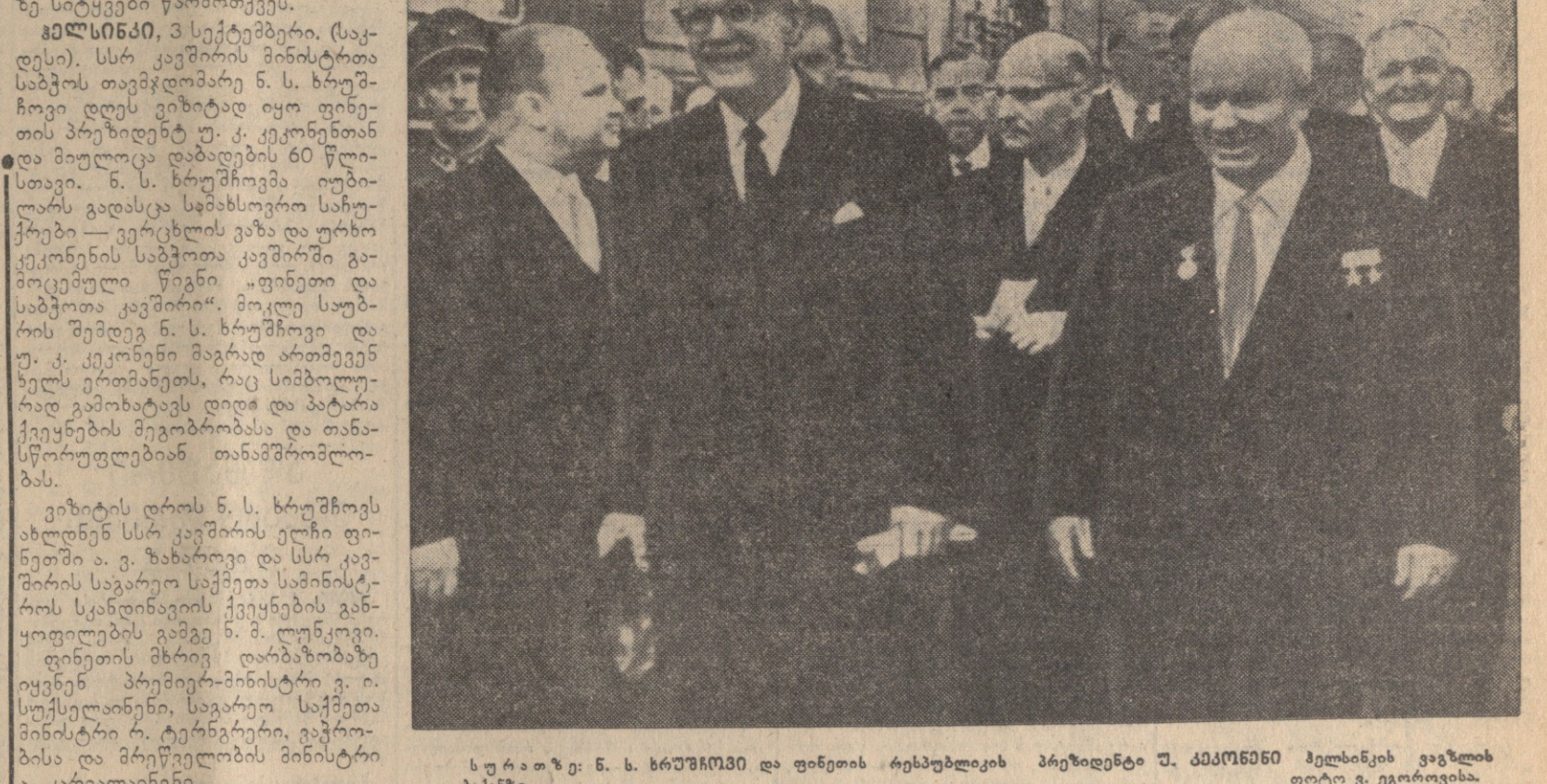
სურათი: ბ. ს. ხრუშჩოვი და ფინეთის რესპუბლიკის პრეზიდენტი... ს. კაროლაინენი.