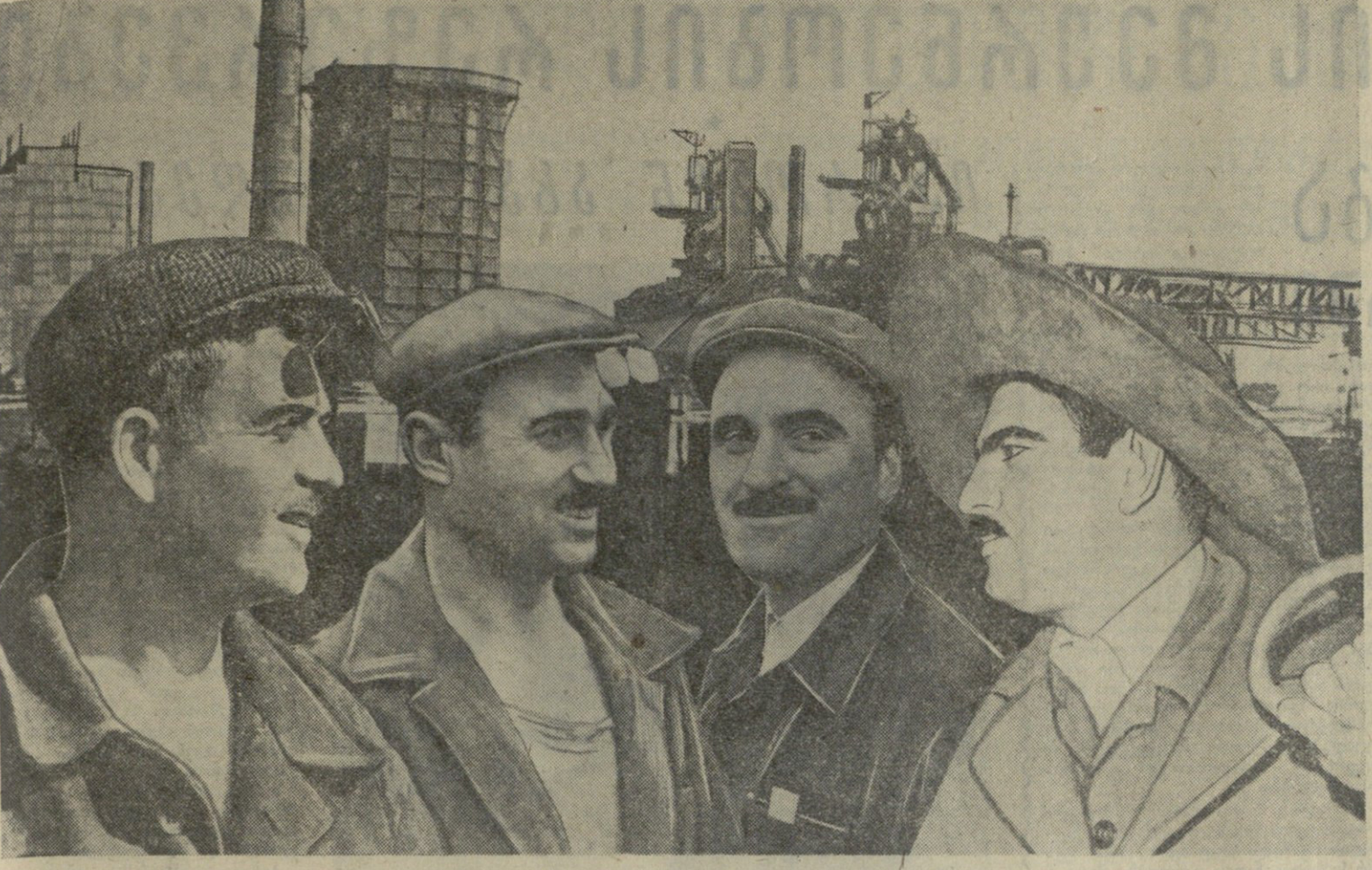
სურამია: ამერიკელების სტალინის სახელობის მეტალურგიული ქარხნის მოწინავე დამონათვა ჯგუფი (მარჯვნივ მარჯვნივ): კომუნისტური შრომის პრიზიორების ნომრის წევრები, მთელი რაოდენობა 10-15-ის ოსტატი. მათგან, კომუნისტური შრომის პრიზიორების ნომრის წევრები, მთელი რაოდენობა 10-15-ის ოსტატი.

მოსახლეობის საყოველთაო მომსახურების საშუალო მოცულობა 1960 წელს შედარებით გაიზარდა. მთლიანი შიდა პროდუქტი 1960 წელს შეადგინა 102 მილიარდი რუბლი. ამავე წელს მთლიანი შიდა პროდუქტი 1959 წელს შეადგინა 98 მილიარდი რუბლი.