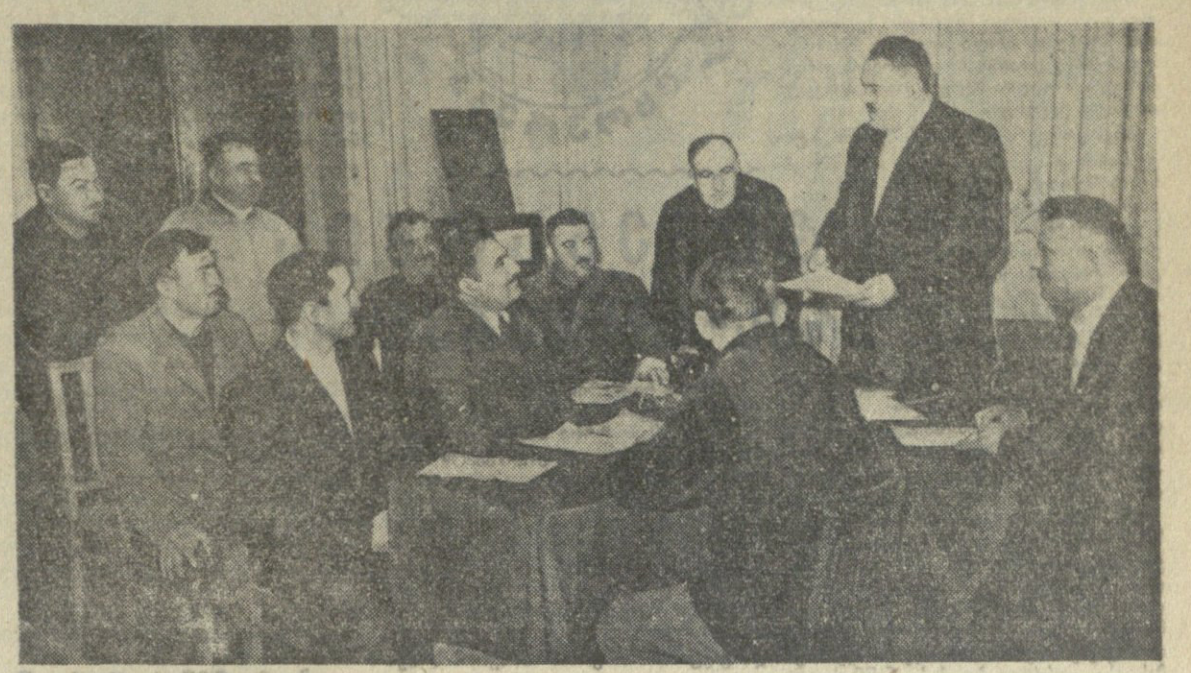
სტრამბა: კოლმეურნეების გამგეობისა და პარტიის გამგეობის წევრები...