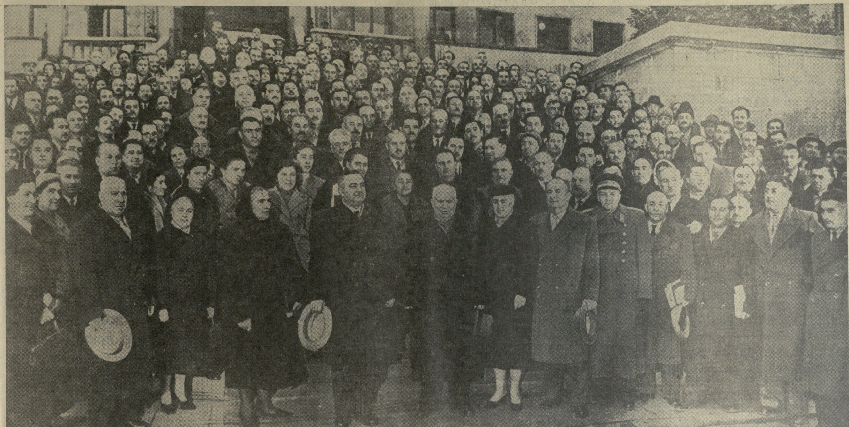
სსრ ცენტრალური კომიტეტის პირველი მდიანი, სსრ კავშირის მინისტრის საბჭოს თავმჯდომარე ამხანაგი ნ. ს. ხრუშჩოვი და საქართველოს პარტიისა და მთავრობის ხელმძღვანელები ამიერკავკასიის რესპუბლიკების სოფლის მეურნეობის მოწინავენი თათბირის მონაწილეები.

ლიერებისათვის და შეიღწევიან გემის დასრულებისათვის. თათბირის მუშაობაში მონაწილეობს მსოფლიოში ყველაზე ხალხი მეურნეობის საბჭოების, სამინისტროებისა და უწყებების სამშენებლო ინდუსტრიის უდიდეს მშენებლობათა და საწარმოთა მოწინავენი და ნოვატორები, სამეცნიერო-საკვლევო და საპროექტო ინსტიტუტების, პარტიული, სამეურნეო, პროფკავშირული და კომკავშირული ორგანიზაციების მუშაკები.