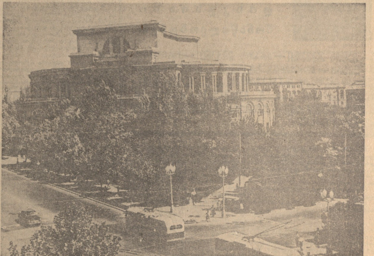
სურათში: ქ. ერევანის სენდარაიანის სახელობის ლენინის ორდენისა და შალვასის სახელმწიფო აკადემიური თეატრი.

ნიუ-იორკი, 7 ოქტომბერი. (საქდესის სპეც. კორ.). გუშინ სადამის გაერთიანებული ერების ორგანიზაციის გენერალური ასამბლეის XV სესიაზე საბჭოთა დელეგაციის მეთაური ნ. ს. ხრუშჩოვი იყო სადლი, რომელიც მის პატივსაცემად გამართა ინდოეთის პრეზიდენტ-მინისტრმა ჯ. ნერუმ. სადლიმ იუწყებდა აგრეთვე სსრ კავშირის საგარეო საქმეთა მინისტრმა ა. ა. გრომეოვმა, სსრ კავშირის მთავარი წარმომადგენელი გერმანიის დემოკრატიული რესპუბლიკის მფრთხილის მინისტრმა ნ. ს. ხრუშჩოვმა და სხვები. ინდოეთის მხრივ იუწყებდა კრიზისი მე-3. ა. მენდიაკოვი და სხვები. ინდოეთის მხრივ იუწყებდა კრიზისი მე-3. ა. მენდიაკოვი და სხვები. ინდოეთის მხრივ იუწყებდა კრიზისი მე-3. ა. მენდიაკოვი და სხვები.