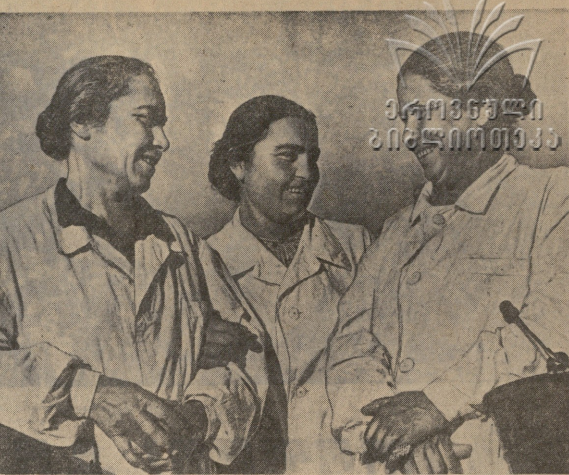
ბ. თაბაგალიძე, ბ. გომეზალაძე, კ. კომუნისტების... სსრკ.