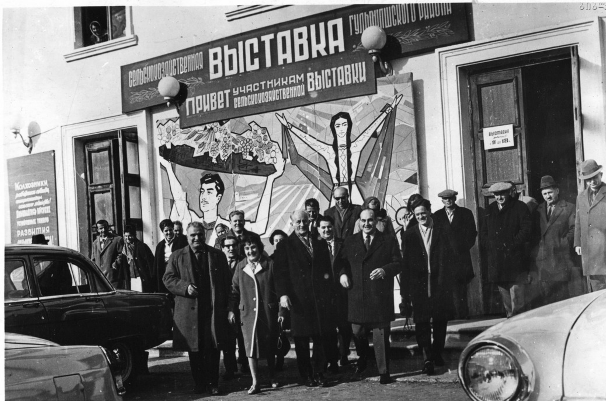
Гости из ГДР на сельскохозяйственной выставке Гульрипшского района Абхазской АССР.