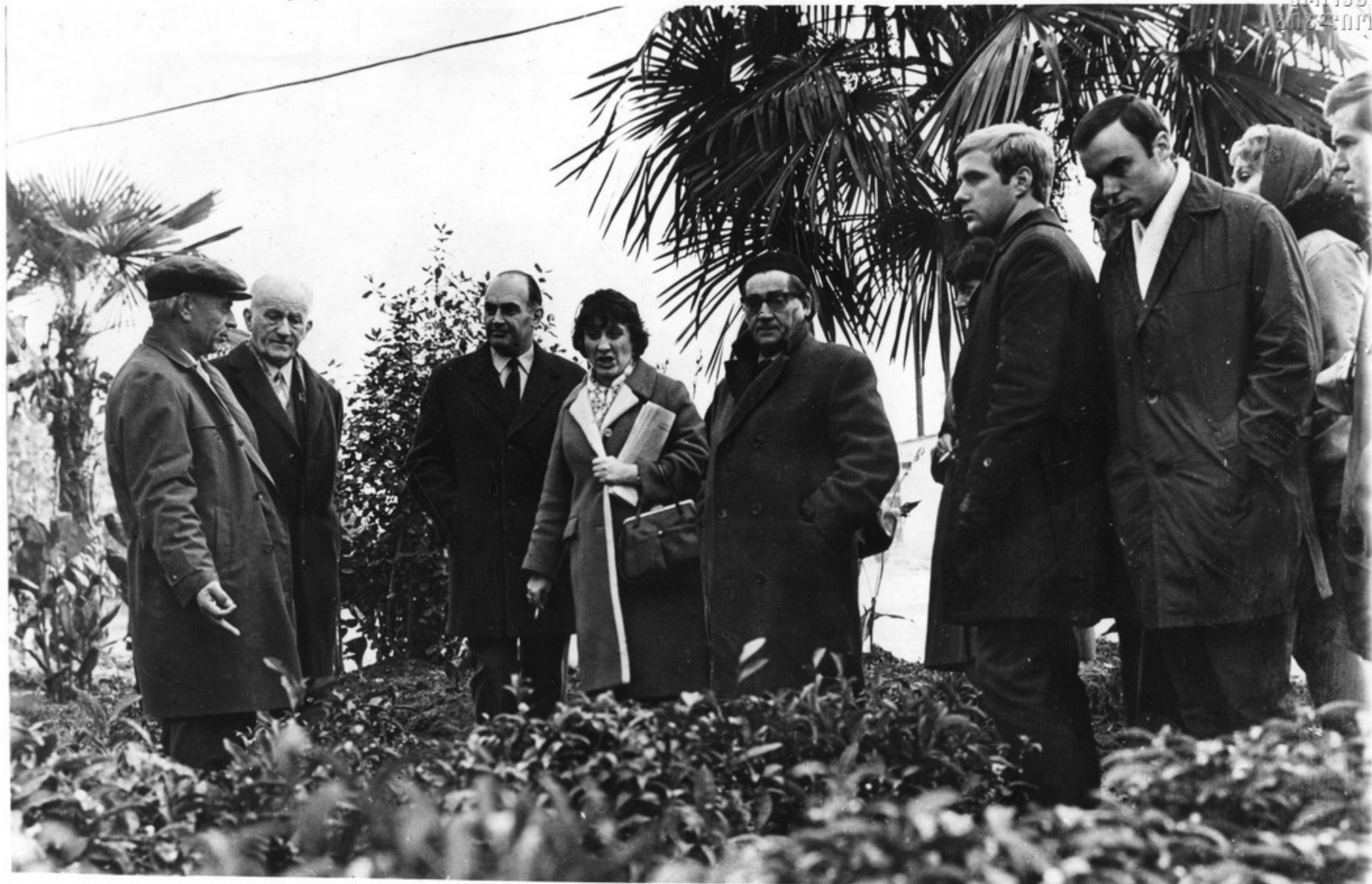
Гости из ГДР на чайных плантациях.