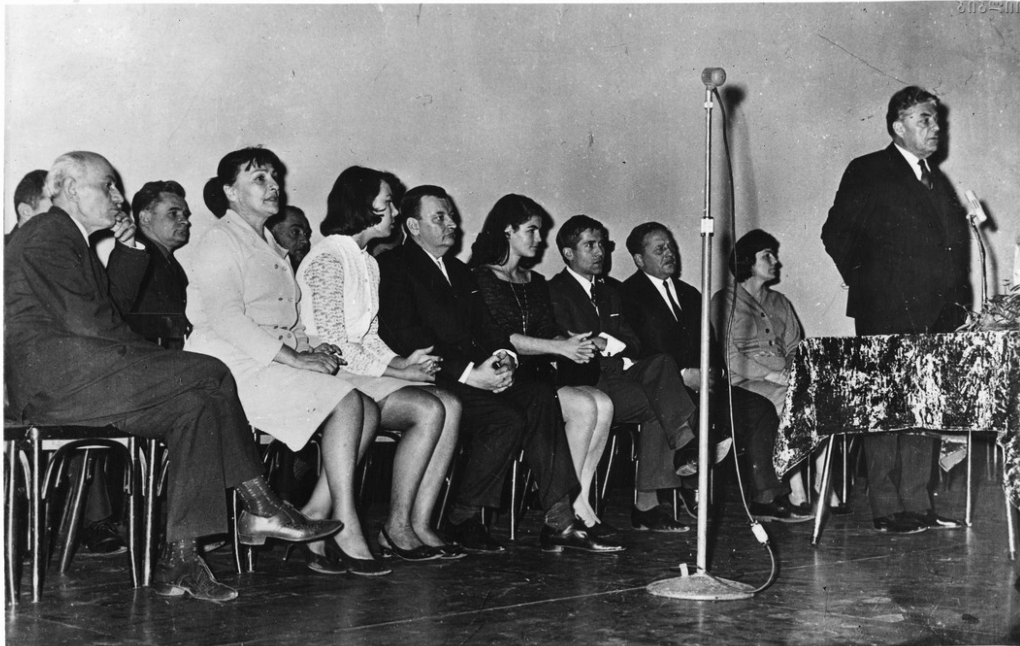
Фестиваль немецких фильмов. Гостей приветствует председатель правления Союза кинематографистов Грузии, народный артист СССР С. Долидзе.