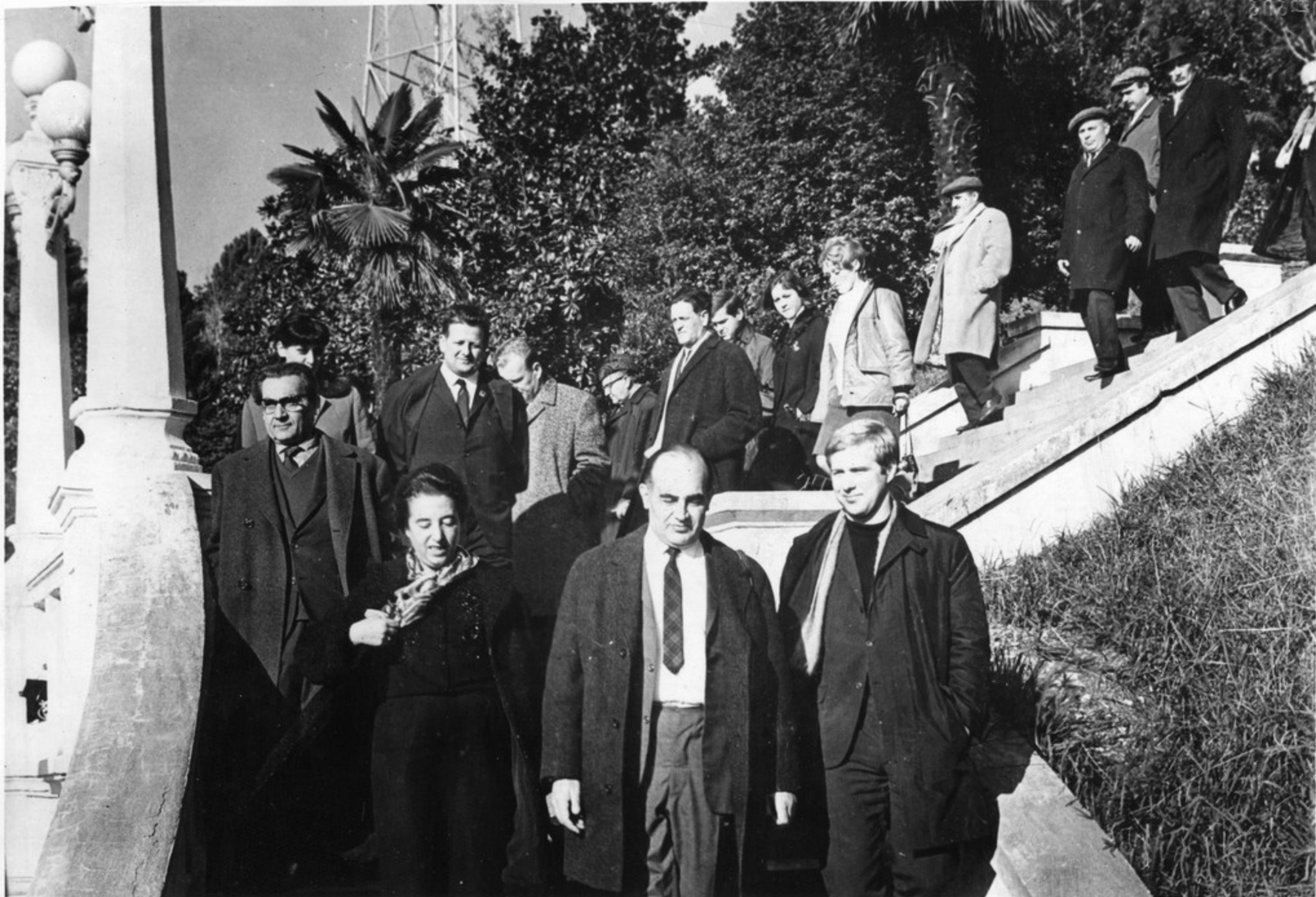
Гости из ГДР знакомятся со столицей Абхазской АССР городом Сухуми.