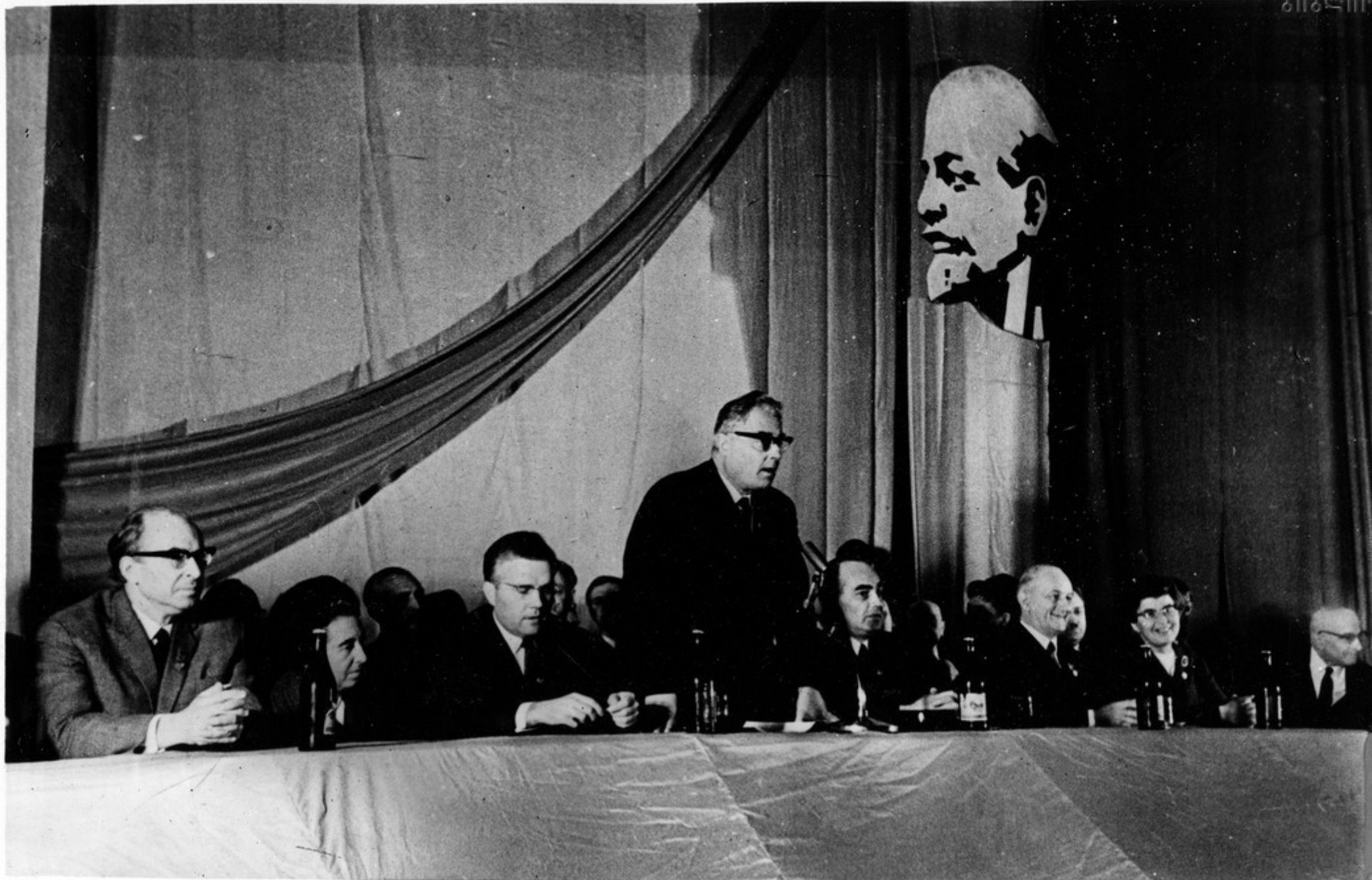
Встреча с участниками Дней культуры ГДР в Грузии в Тбилисском государственном университете.