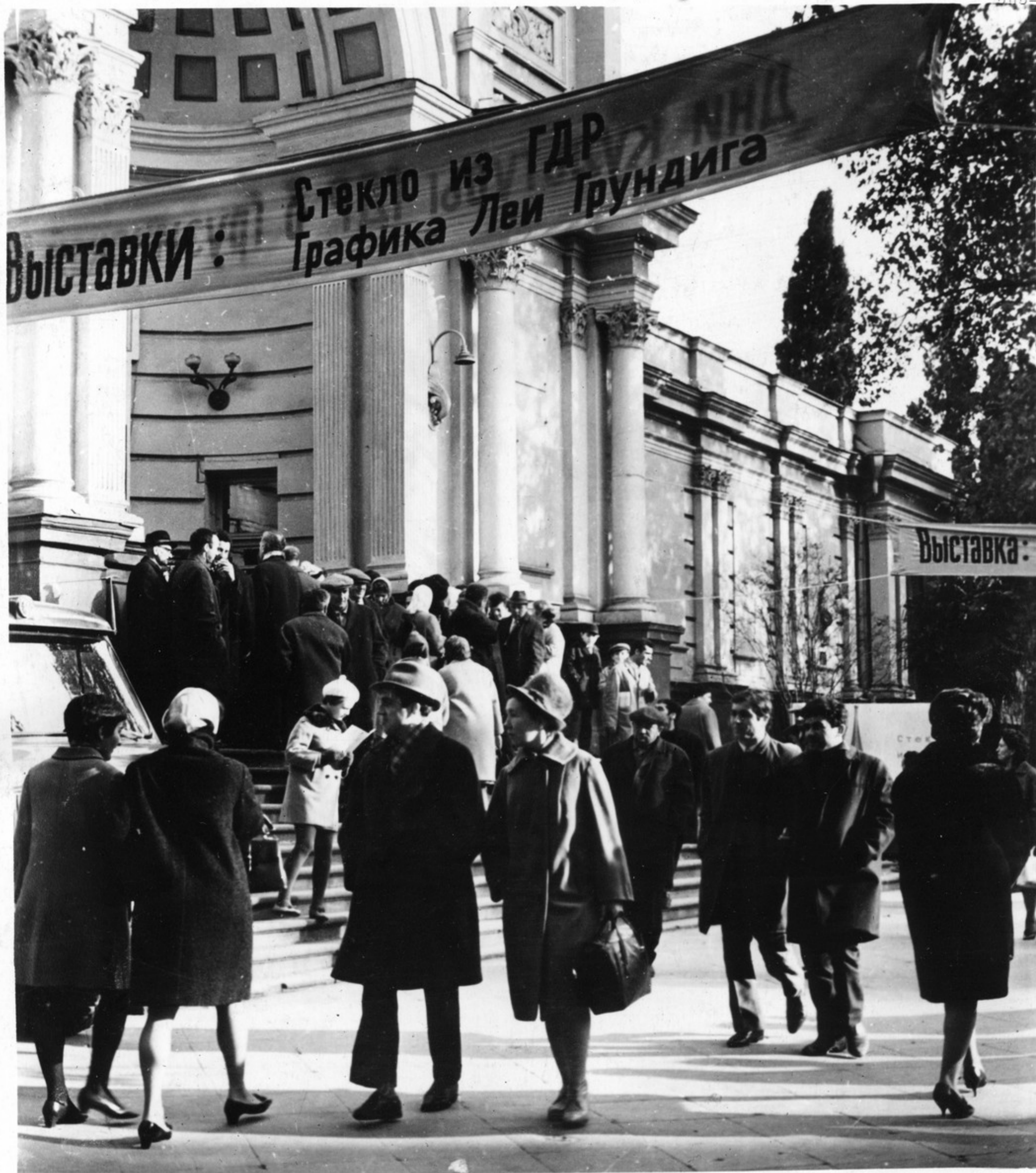
Здание картинной галереи Грузии, где открылись выставки: „Стекло из ГДР“ и „Графика Леи Грундига“.