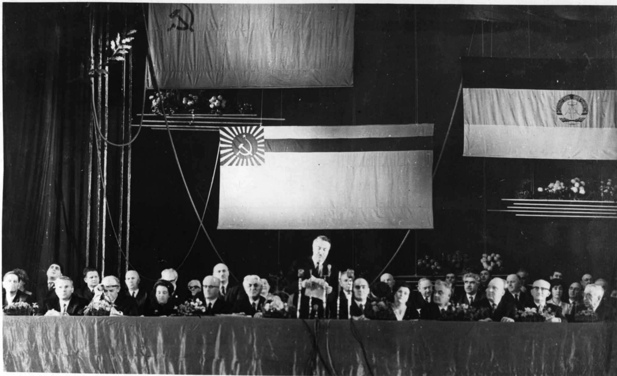
Торжественное открытие Дней культуры ГДР в Грузии.