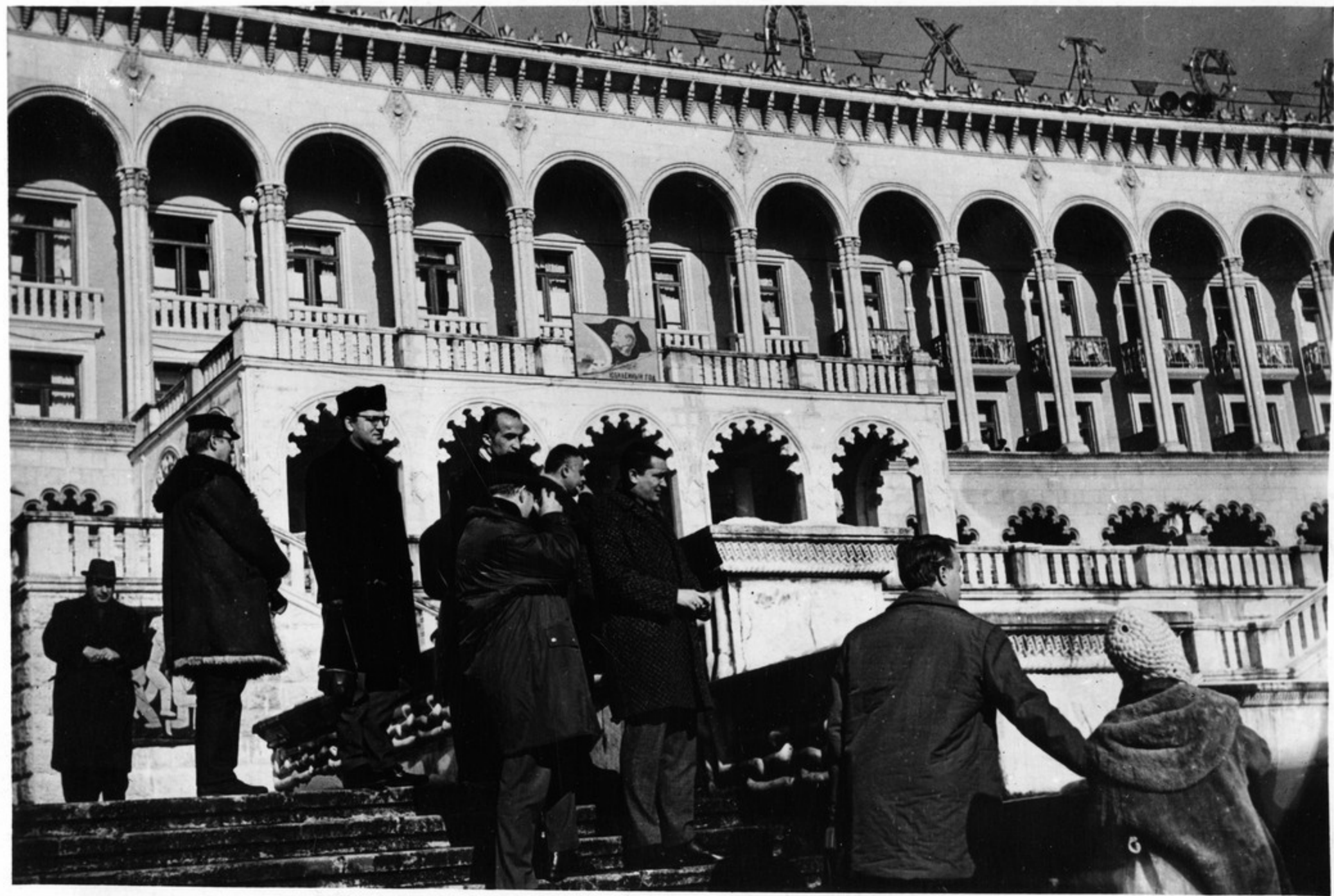
Гости из ГДР побывали на всесоюзной здравнице Цхалтубо. На снимке: у санатория „Шахтер“.