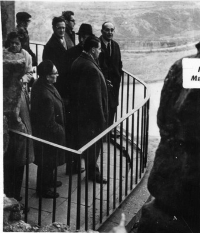
Гости любуются панорамой Мцхета

Делегация ГДР посетила древнюю столицу Грузии Мцхета.