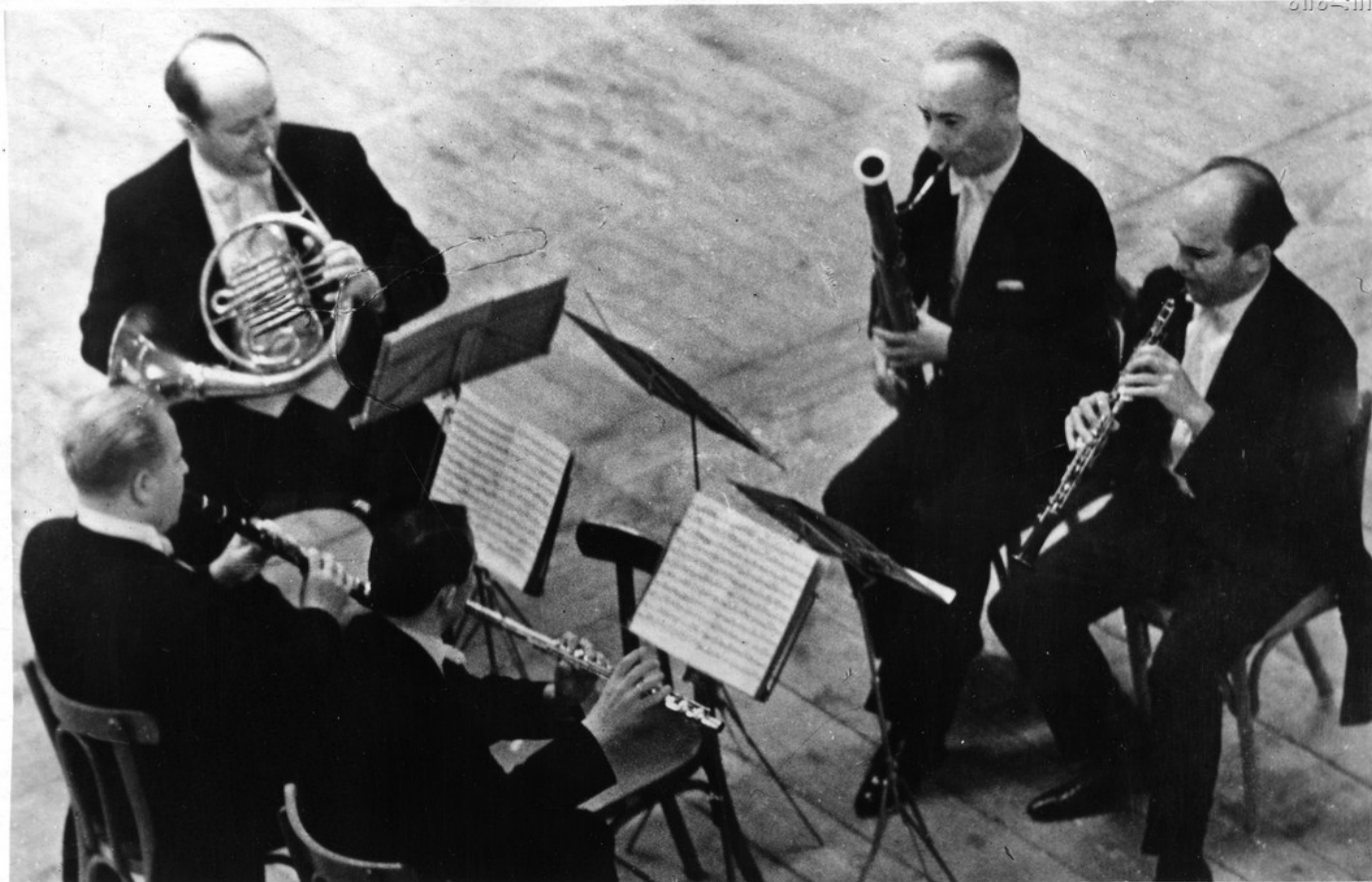
Выступление духового квинтета дрезденской „Штаатскапеллы“, привлекло большой интерес многих ценителей музыки. Оно состоялось в Большом зале Тбилисской консерватории. На снимке: выступление духового квинтета.