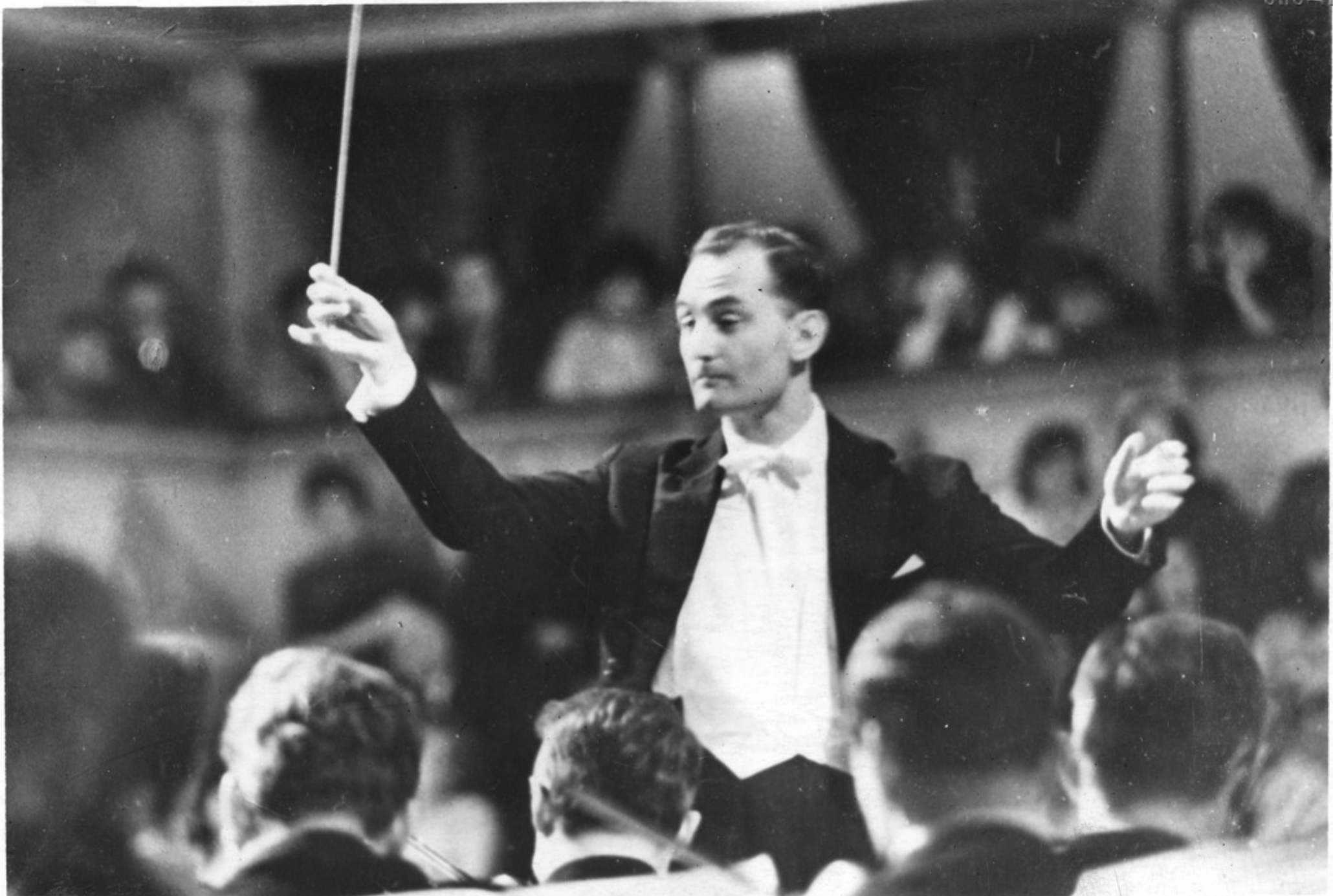
Главный дирижер Дрезденского симфонического оркестра М. Турновский.