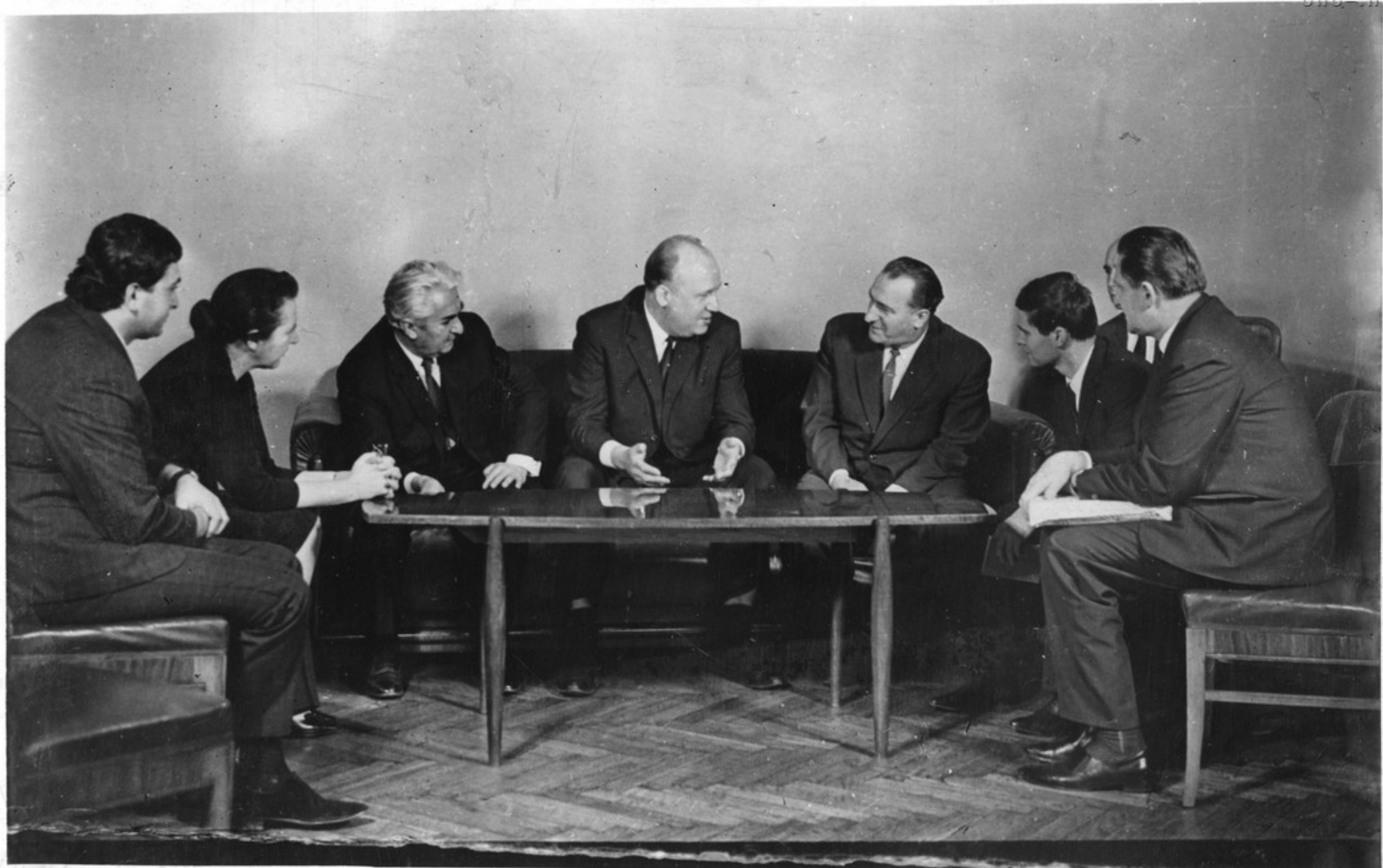
Прием у Председателя Президиума Верховного Совета Грузинской ССР Г. С. Дзоценидзе Чрезвычайного и Полномочного Посла ГДР в СССР Хорста Биттнера.