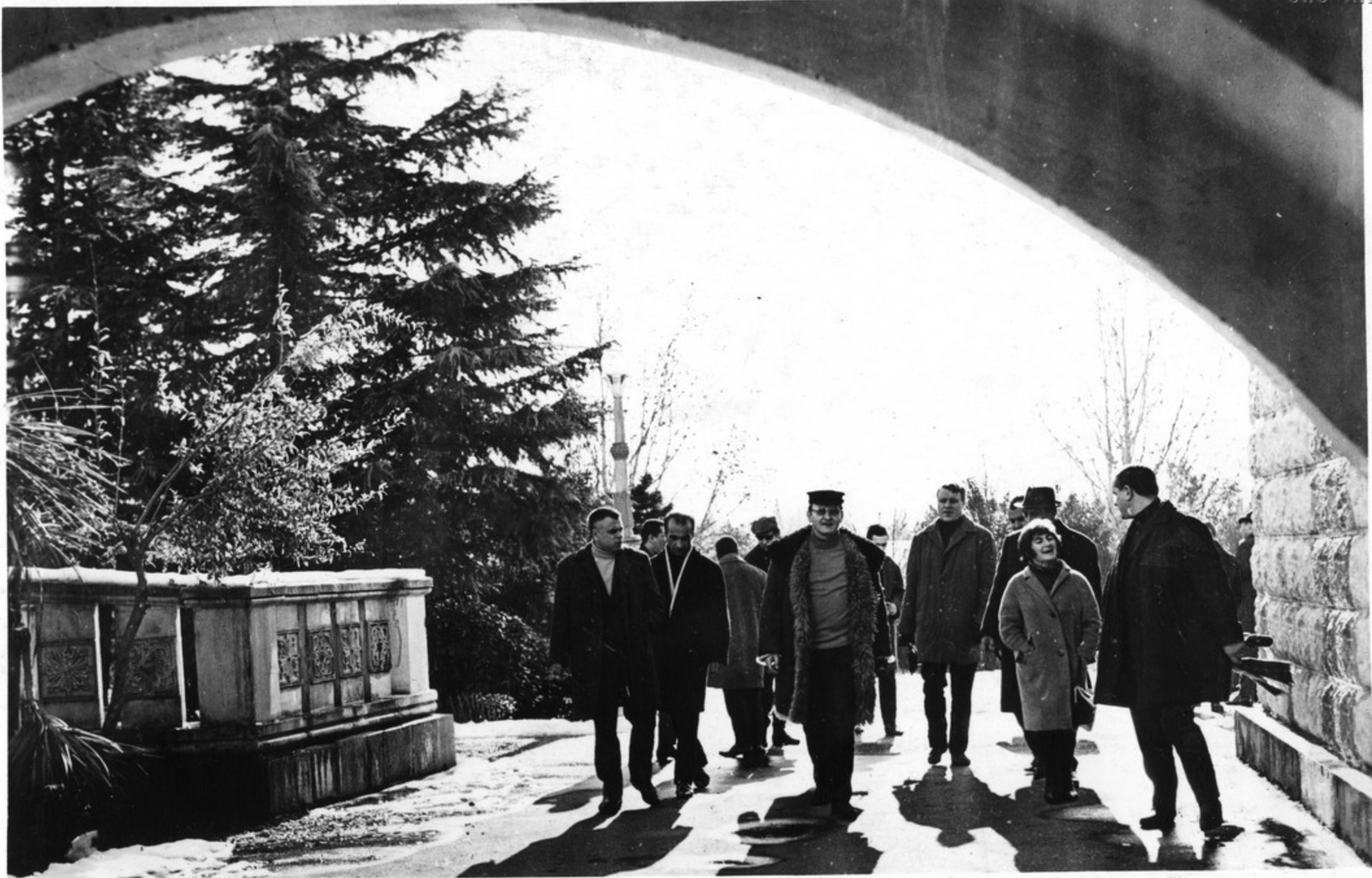
Участники делегации ГДР в городе Кутаиси.