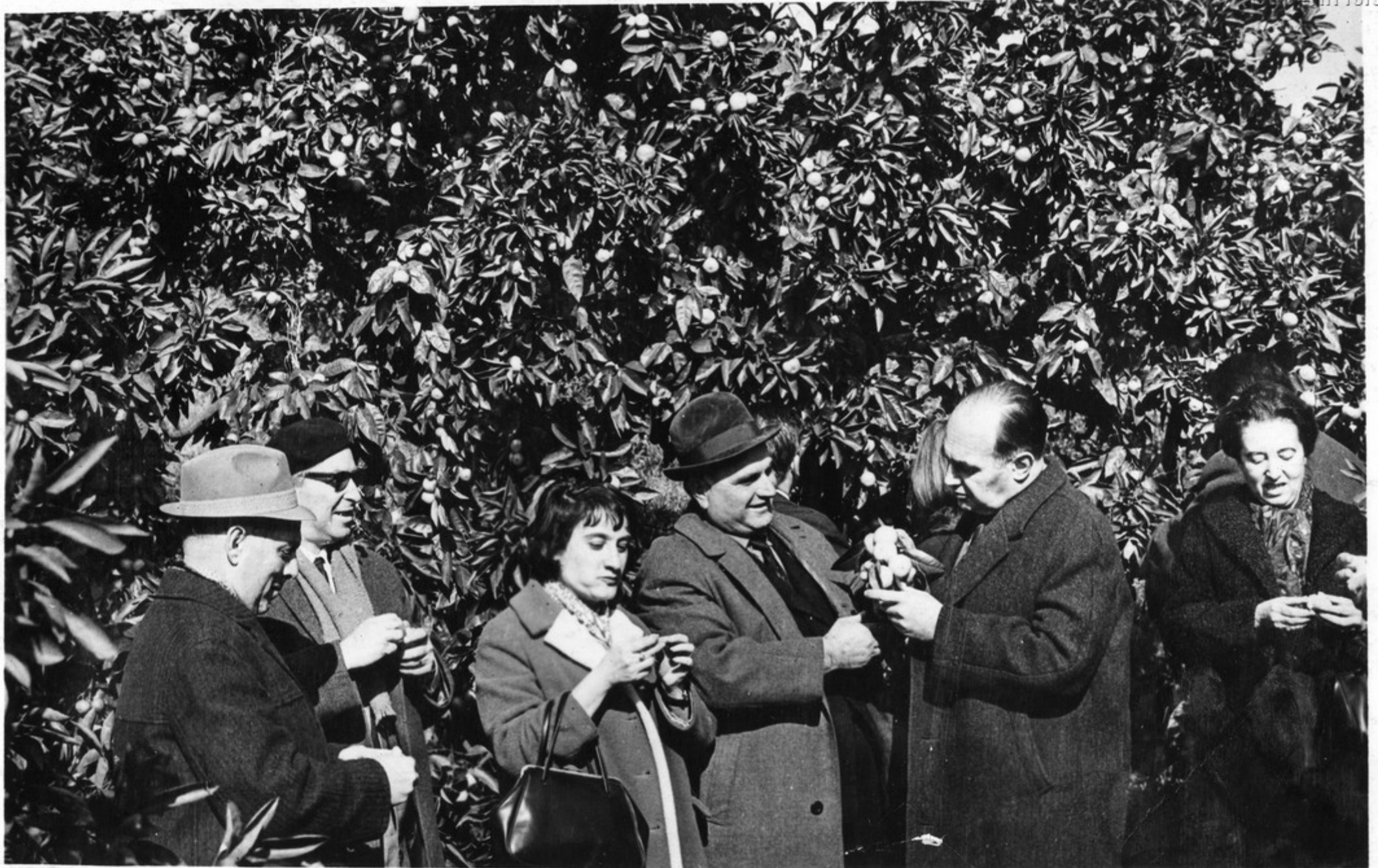
Гости из ГДР осматривают цитрусовые плантации совхоза им. Ильича села Гульрипши.