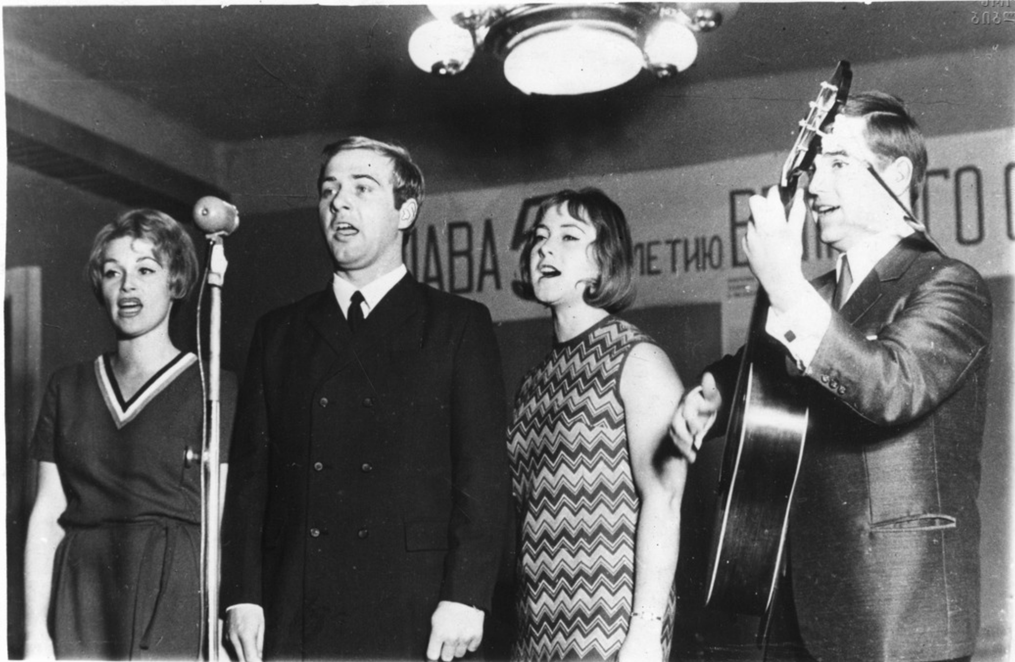
Концерт на заводе шампанских вин. Выступают студенты ГДР.