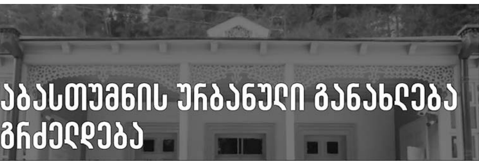
აბასთუმის უბანული განახლება გრძელდება

ეგრეთ ნოდებული კვლევის ავტორების მიერ შეგნებულად იქნა უგულვებლყოფილი ის ფაქტიც, რომ აბასთუმის წყალმომარაგების სისტემის რეაბილიტაციის პროექტირების შესყიდვისთვის, „გაერთიანებული წყალმომარაგების კომპანია“ ტენდერი 2016 წელს გამოაცხადა. 2018 წელს დაიწყო