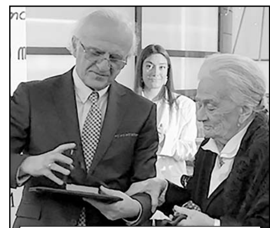
უნივერსბბბბბ რბბბბბ მამუკა თაზბბბბბ ბრბბბბ რობბბბბბ უბრბბბ პრბბბბბ ბბბბბბბბბ ნათელა ვასაძეს

გმიგოლ რობბბბბბ სახელობის უნივერსბბბბბ 8 დეკემბერს საოცარ, განუბბბბბ გარბბბბბ მიგვიწვბბ... აღმბმენებლის ხეივანიდან დედაქალაქის შემოსასვლელში მდებარე ულამაზესი არქიტექტურის მქონე კამპუს სახალწლოდ განსაკუთრებულად გახლდათ მოკაზმული. Alma Mater-ში კლასიკური მუსიკის ჰანგები უღერდა... შეგახსენებთ, რომ გრიგოლ რობბბბბ სახელობის უნივერსბბბბბ არსებობის 30-წლიან ისტორიას ითვლის. 1996 წლიდან ის ღბრსეულად ატარებს XX საუკუნის ყველაზე გამოჩენილ და კოლორიტუნი მწერლის გრიგოლ რობბბბბ სახელს. უნივერსბბბბბ გამოიარა მრავალი ქართველი და დღეს სამართლიანად ითვლება ერთ-ერთ საუკეთესო უმაღლეს სასწავლებლად... უნივერსბბბბბ სტუდენტები აქტიურად არიან ჩართულნი თეორიულ და პრაქტიკულ სწავლებბბბ. წარმატებულ სტუდენტებს საშუალება აქვთ საზღვარგარეთ გაყვლით პროგრამებში მიიღონ მონაწილეობა. სასამბობნობა იმის ხაზგასმაც, რომ უნივერსბბბბბ კურსდამთავრებულები, დასაქმების თვალსაზრისით, მოწინავე ადგილს იკავებენ ქვეყნის და, სხვათაშორის, საერთაშორისო მასშტაბბბბბ. უნივერსბბბბბ მთავარი მიღწევა-სწავლებლის მაღალი ხარისხი, სამეცნიერო მიღწევებზე დაფუძნებული საგანმანათლებლო პროგრამების და სტუდენტის ინტერესებზე მორგებული სასწავლო გეგმის განხორციელებბბბბბთან ერთად, გახლავთ ოჯახური გარემო, რაც სტუდენტებსაც და პროფესორ-მასწავლებლებსაც ერთნაირი მონდობებით იბბბბბს ნოყაყობით სავსე უნივერსბბბბბ.