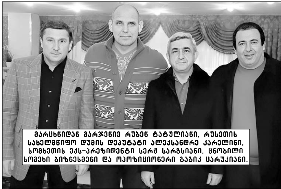
მარცხნიდან მარჯვნივ რუპან ტატულიანი, რუსეთის სახელმწიფო დუმის დეპუტატი ალექსანდრა კარალინი, სომხეთის ექს-კარგი დენტი სერჟ სარგსიანი, სომხეთის სომეხი ბიზნესმენი და ოპოზიციონერი ბაზიკ სარაქიანი.

ბოლო ორ წელიწადში სომხეთიდან აფხაზეთში 20 000-ზე მეტი ყარაბაღელი სომეხი ჩაასახლეს!