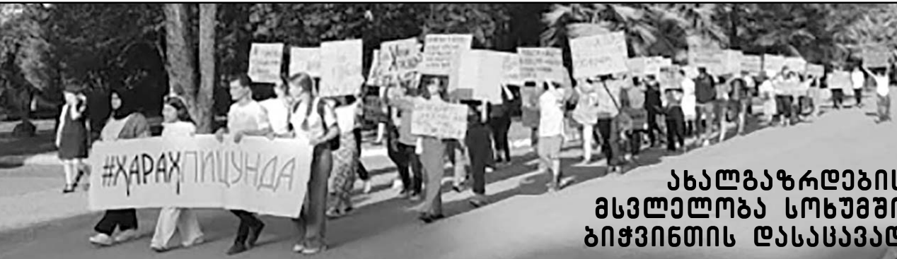
ახალგაზრდების მსვლელობა სოხუმში ბიჭვინთის დასაცავად