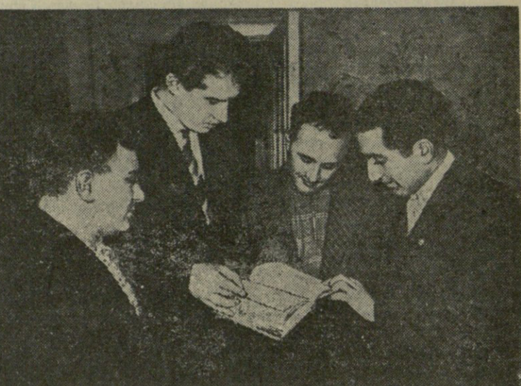
დღეს საღამო 8 საათზე თბილისის რესპუბლიკის სახელობის სახელმწიფო თეატრში სახშირად გაიხსნება სსრ კავშირის XXVI პირველობის ფინალი ჯალდრეკში.

საქართველოს კკ ცენტრალური კომიტეტის პლენუმმა აითი დაამთავრა მუშაობა. (საქდესი).