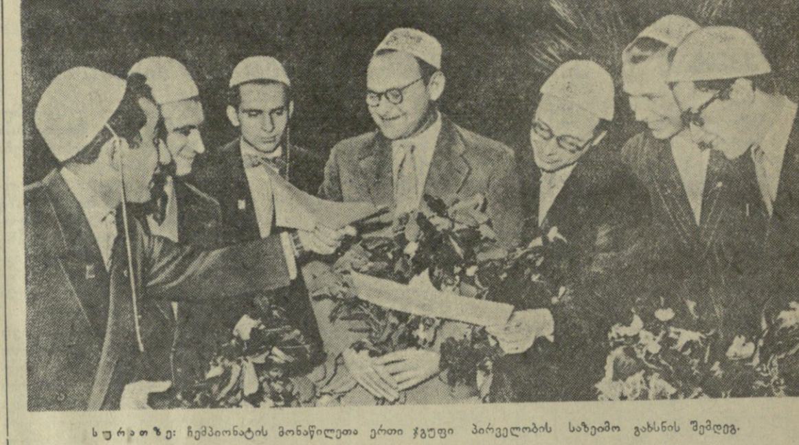
სურათი: ჩემპიონატის მონაწილეთა ერთი ჯგუფი პირველობის საბჭოში გახსნის შემდეგ.