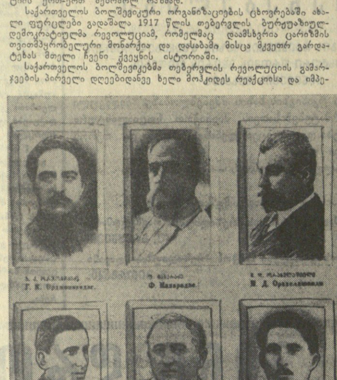
საბჭოთა კავშირის ცენტრალური კომიტეტის წევრთა ერთი ჯგუფი... ა. ს. ლენინი, მ. თხიველიძე, მ. ბაგრატიონი...