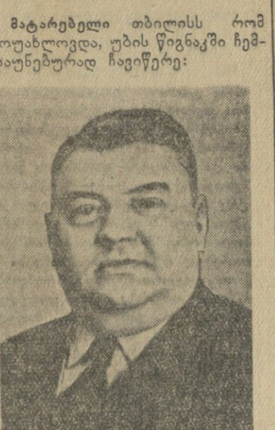
მატარებელი თბილისი რომ...