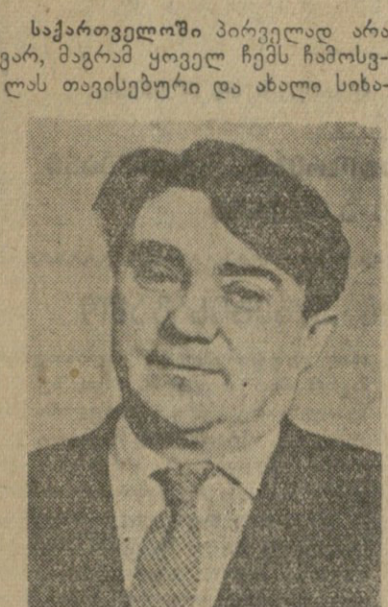
საქართველოში პირველი არა...

ცხოვრების მშობლიური წინსვლა და საპარტიო სამართლებრივი აღმავლობა