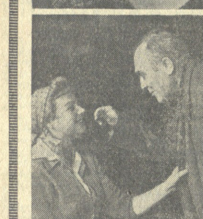
სურათებში: ორი სცენა სპექტაკლ „ბაბრის სულეიმანი“...

30 წლის ანსამბლი ანსამბლის ხალხური სიმღერისა და ცეკვის სახელმწიფო ანსამბლი 80 წელი შეუსრულდა.