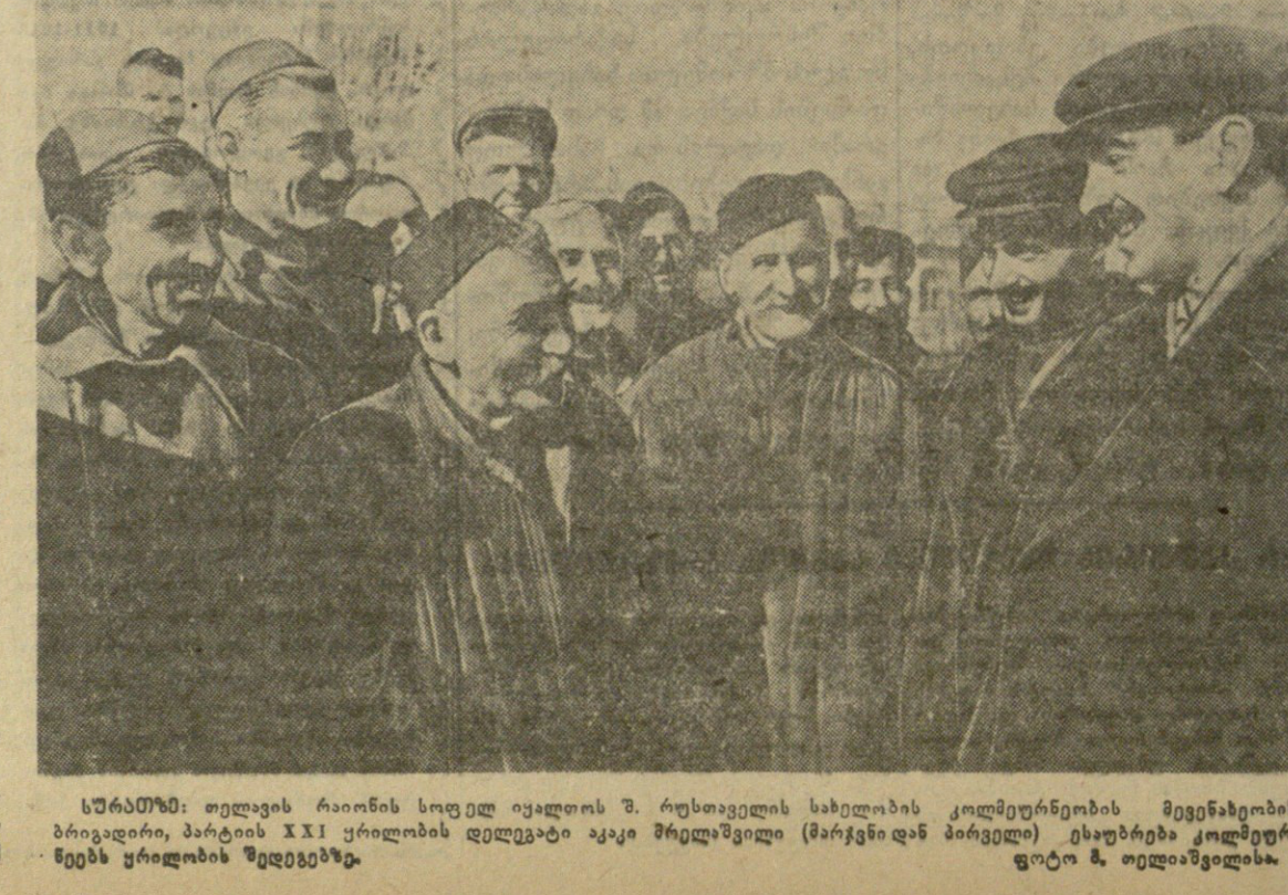
სტალინი: თბილისის რაიონის სოფელ ივანოვს კოლმეურნეობის მფლობელების მიერ შეიქმნა პირველი, პარტიის XXI ყრილობის დღიური დაგეგმვა (მარჯვნივ პირველი) ესაბრება კოლმეურნეობის წევრების შედეგებს.