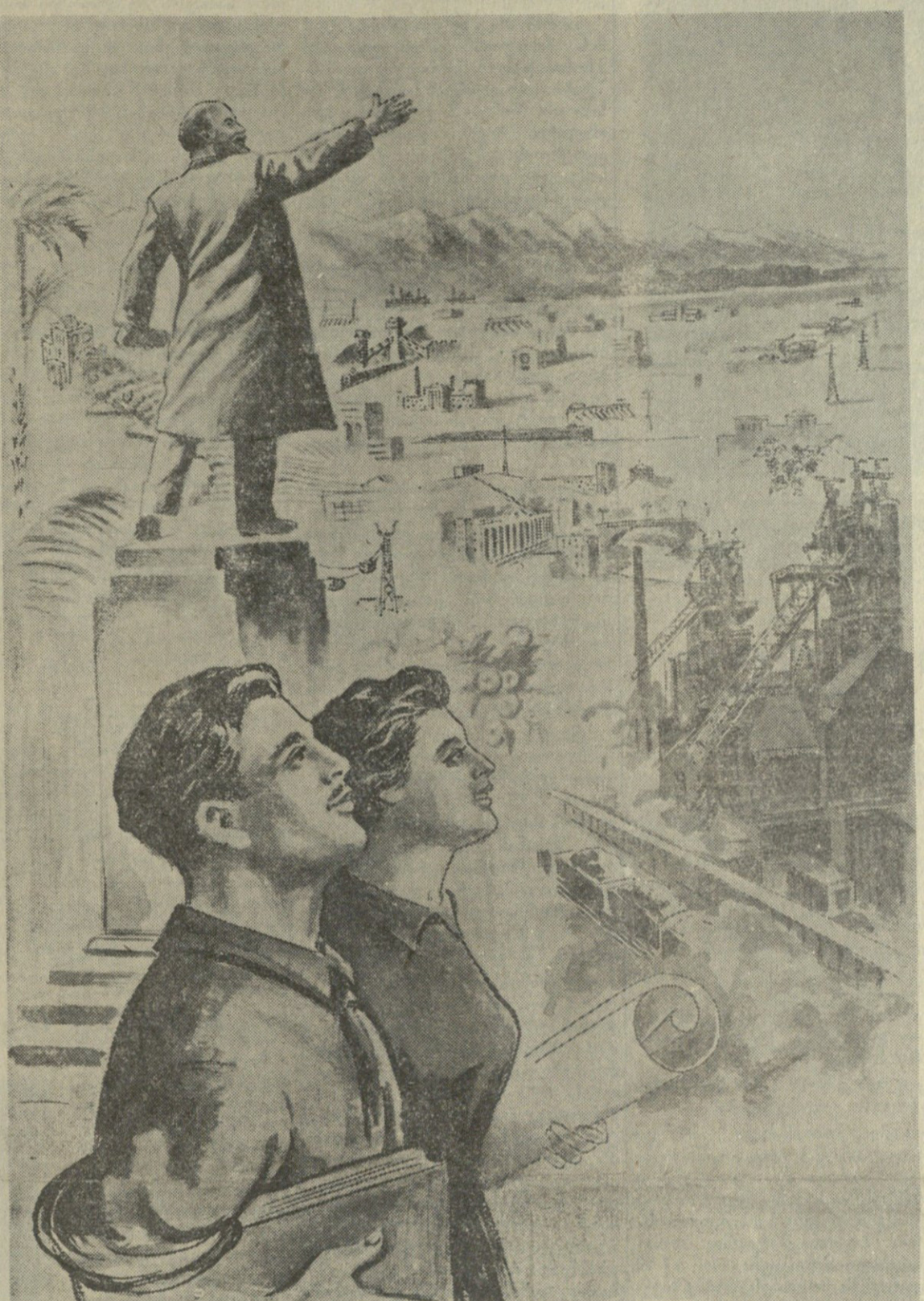
წინ, კომუნისტების გზაზე წინაშეა