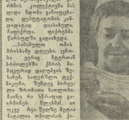
მუშაობის დასრულების შემდეგ იგი დაბრუნდა სახლში. მუშაობის დასრულების შემდეგ იგი დაბრუნდა სახლში.