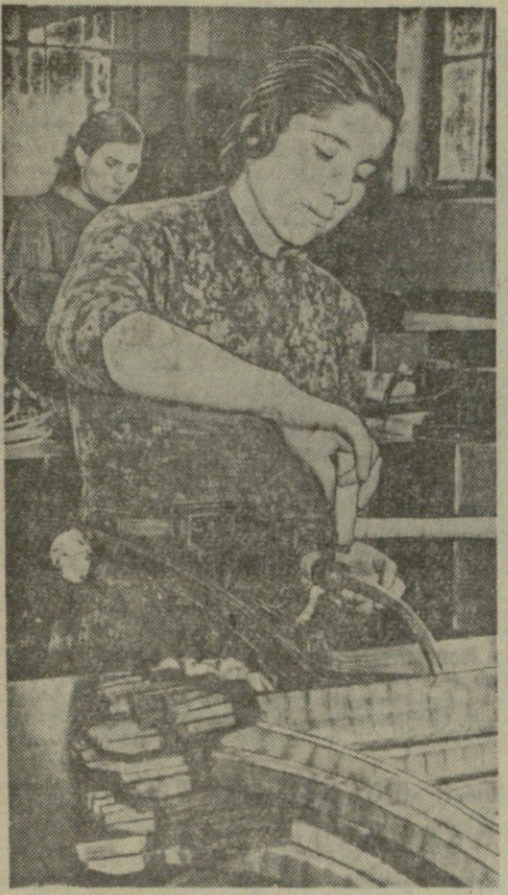
სერაფიმე: ღია ნასყიდვები.