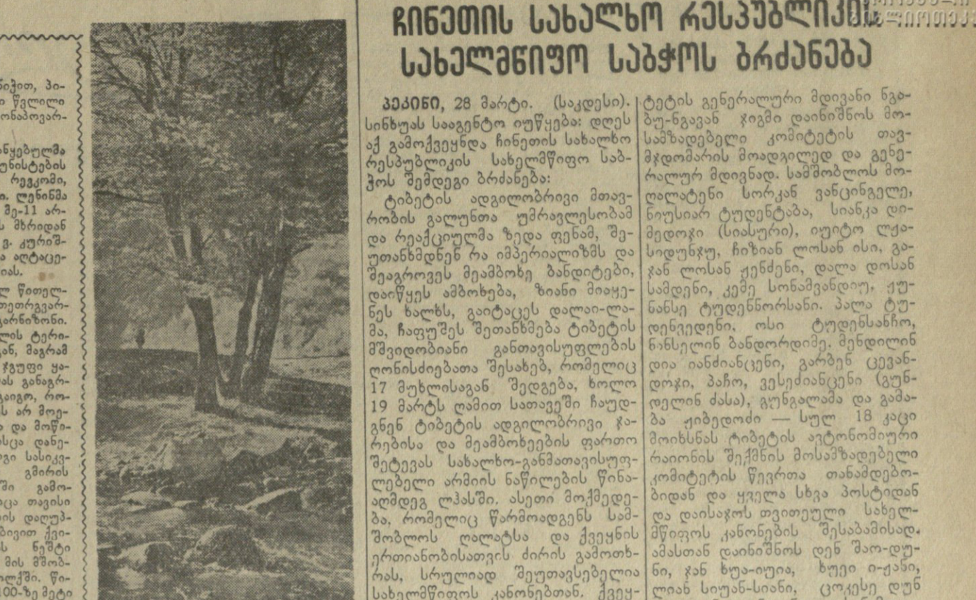
გაზაფხულია, გადვიძებულა მშობლიური ბუნება. თორთაფხულია დასაზღვრებელი ბორკი-ხაღის ხეები. ვაკელოდობენ ეკლესია ბარკოვლელს ვეფხვი წყარო ორდენი

წითელწყაროს (საქდესი) დაბ. წითელწყაროს ცენტრში პატარა ძველი... ჰარისკაცი უკვამლო... მარტი 10 კა.