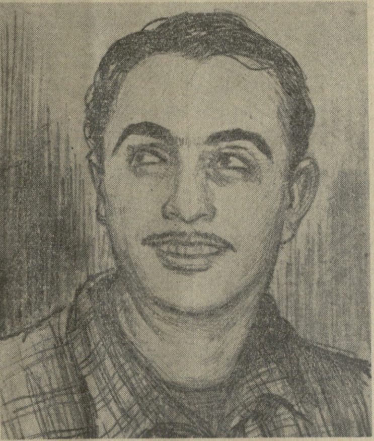
რესპუბლიკის დამსახურებული რაიონალური მ. ხაჩიძის პ.