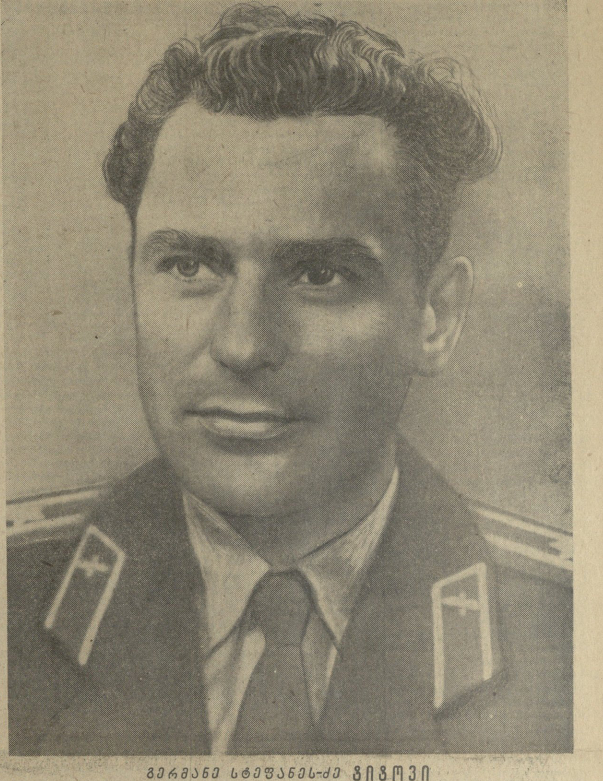
გომინი სტეფანეს-ი გომინი

საბჭოთა კოსმოსურმა თანამგზავრმა ხომალდმა „ალმოსავლეთ-2“-მა, რომელსაც კოსმონავტი მიხეილ გომინი მართავდა, 17-ჯერ და მიტოვა მთლიანად სსრ კომუნისტური პარტიის და მთლიანად სსრ კომუნისტური პარტიის მიერ დაარსებული კოსმოსური პროგრამის მიზანმიმართულად განხორციელების მიზნით. საბჭოთა კავშირის კომუნისტური პარტიის ცენტრალური კომიტეტისა და საპარტიო სსრ მმართველთა დეპუტატების საბჭოს ორგანო საბჭოთა კავშირის კომუნისტური პარტიის ცენტრალური კომიტეტისა და საპარტიო სსრ მმართველთა დეპუტატების საბჭოს ორგანო