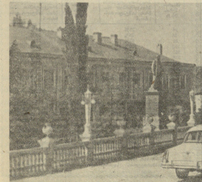
აი, ისიც, განახლებული შრომის ბეიზაი! მარცხენა მხარეს ხედავთ სოფლის სახლს, რომელიც მთავრად იტყვს, ოღონდ მოშორებით მზეზე, პრწყინავს სოფელურ ნიშნების გამკვობა, მხარაძელების და გენინსკელების ტრადიციული მეგობრობის სახლად სიციხისა და კლდის შენობის, რომლის ძირსადაც მონატული დარბაზი შრომის სახალს, სადაც მოთავსებულია სეკო ოჯახის სახლი და სხვა ობიექტი.

ვდგავარ მთაზე... და სიხუმის იღვწალი მემის ენა და მიტაცებს სწრაფი ფრთებით პოეტური აღმავრენა. ვხედავ სიხუმის ხედავ დაფანს, ვხედავ მღვთარ ნასაკრალს, ვხედავ სოფლის სიციხეებს, განახლებას თვლით შიარულს. გაგონდება უნებლიედ ეს სტროფი გალაკტიონის „გურიის მთებიდან“, როცა მალბობიდან გასცემი ქველუც სოფელს, თავმოწონილ რომ იფრეებს გახფხფულს მრავალფეროვან სამოსელს.