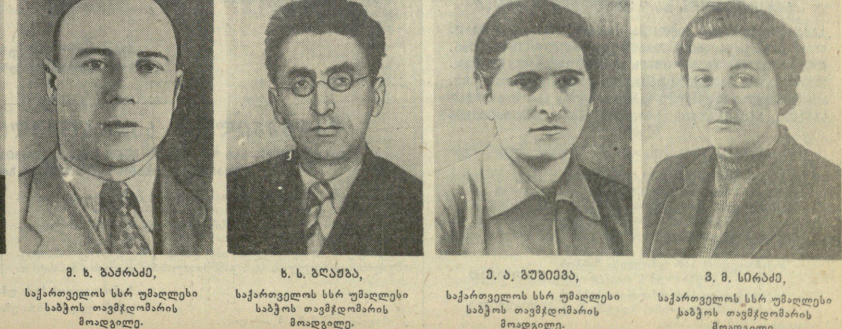
ბ. ლ. კუმბახიძე, საქართველოს სსრ უმაღლესი საბჭოს თავმჯდომარე. ბ. ს. ჯვაჩავა, საქართველოს სსრ უმაღლესი საბჭოს თავმჯდომარის მოადგილე. ნ. ს. ჯვაჩავა, საქართველოს სსრ უმაღლესი საბჭოს თავმჯდომარის მოადგილე. მ. ა. ჯვაჩავა, საქართველოს სსრ უმაღლესი საბჭოს თავმჯდომარის მოადგილე. ბ. მ. ნიშვილი, საქართველოს სსრ უმაღლესი საბჭოს თავმჯდომარის მოადგილე.