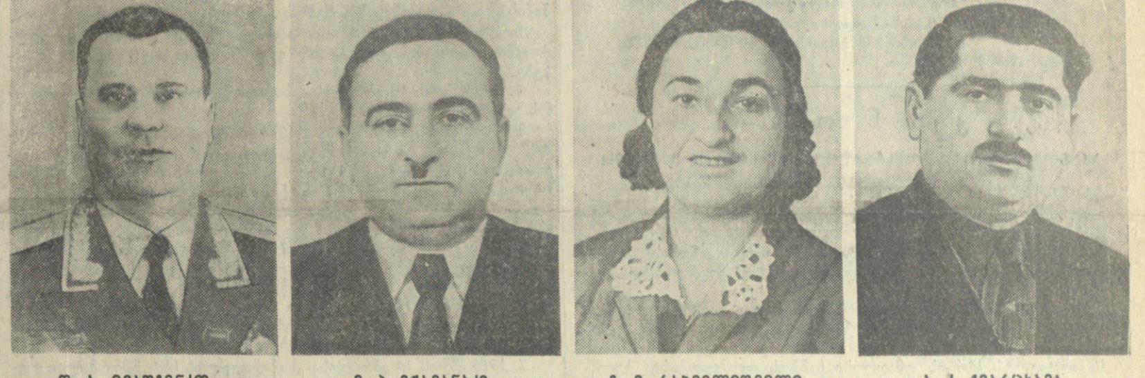
ლ. ა. ნიშვილი, საქართველოს სსრ უმაღლესი საბჭოს პრეზიდიუმის წევრი. ბ. ბ. შვაჩავა, საქართველოს სსრ უმაღლესი საბჭოს პრეზიდიუმის წევრი. ბ. ბ. რახველიშვილი, საქართველოს სსრ უმაღლესი საბჭოს პრეზიდიუმის წევრი. ა. კ. შვაჩავა, საქართველოს სსრ უმაღლესი საბჭოს პრეზიდიუმის წევრი.