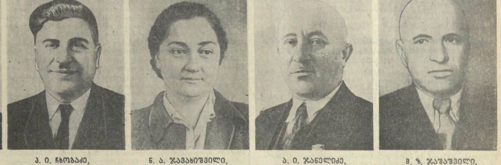
ა. ნ. შვაჩავა, საქართველოს სსრ უმაღლესი საბჭოს პრეზიდიუმის წევრი. ბ. ნ. ნიშვილი, საქართველოს სსრ უმაღლესი საბჭოს პრეზიდიუმის წევრი. ნ. ა. ჯვაჩავა, საქართველოს სსრ უმაღლესი საბჭოს პრეზიდიუმის წევრი. ა. ნ. ჯვაჩავა, საქართველოს სსრ უმაღლესი საბჭოს პრეზიდიუმის წევრი.