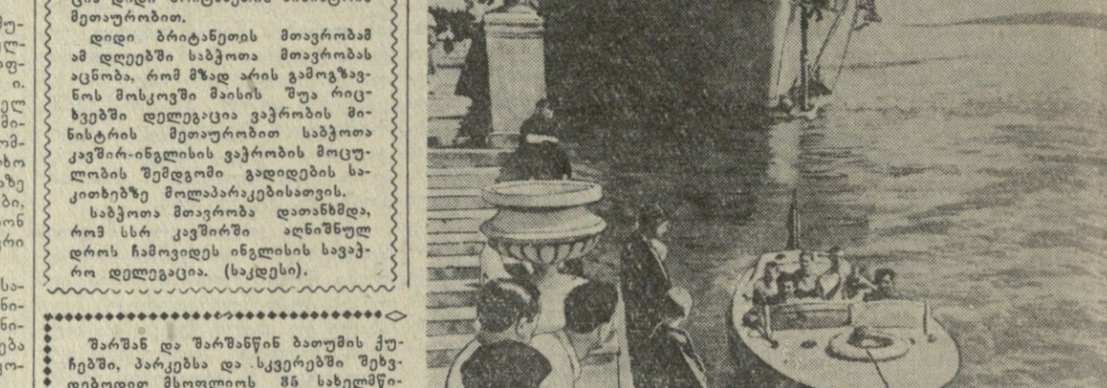
საბჭოთა კავშირის მთავრობისადმი