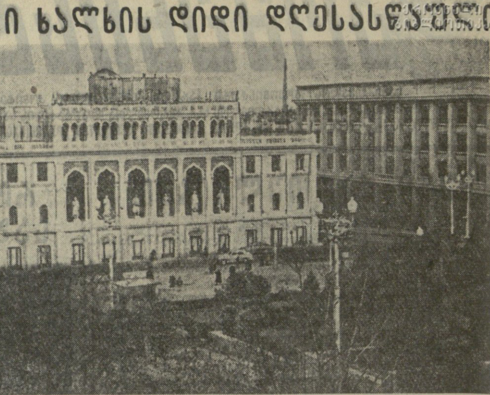
სსრკ-ს დახმარებით საქართველოში მშენებლობის სამუშაოები...