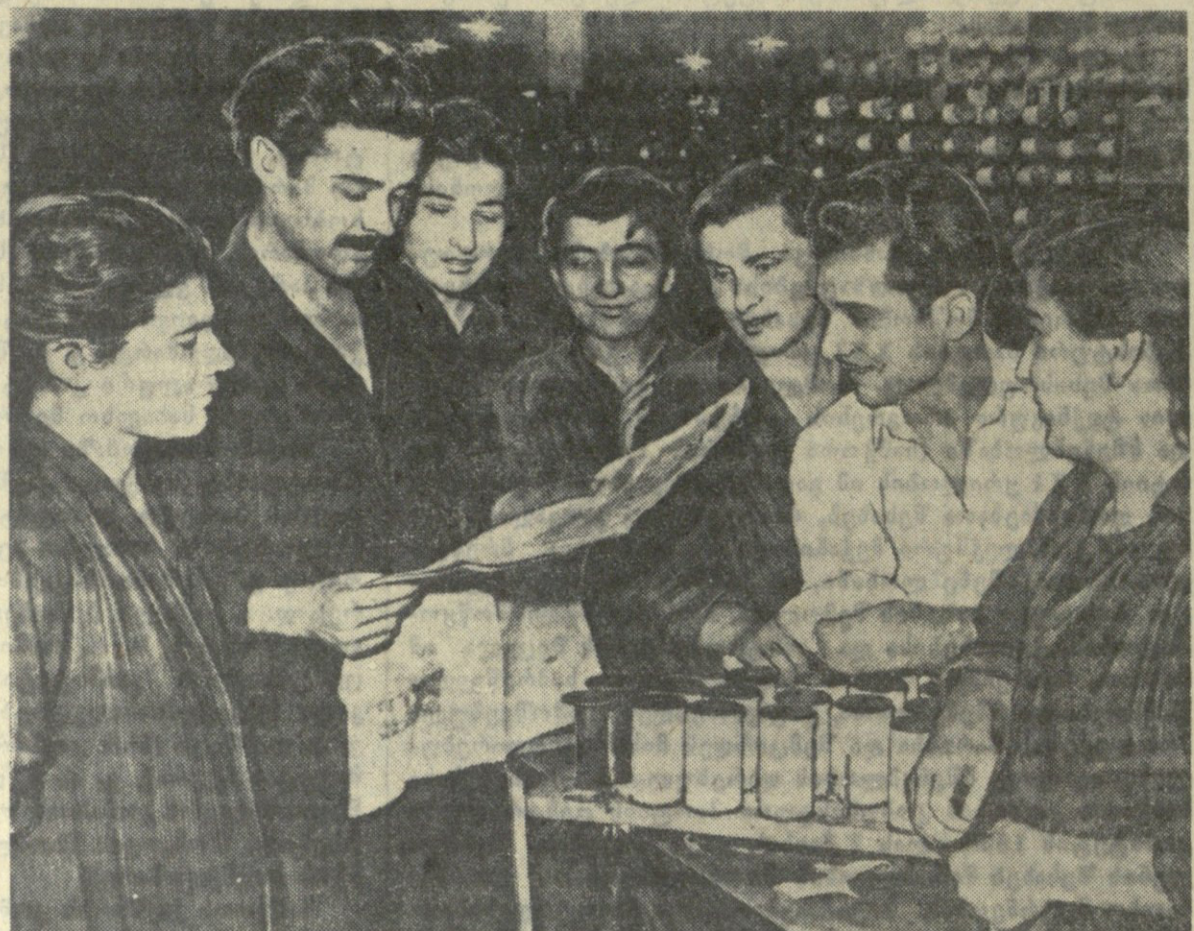
თბილისის აბრეშუმსაქოვა ფაბრიკის მოსამზადებელი სამუშაოს ავტორი ზ. თედიაშვილი მუშებს აცხობს სკკ ცენტრალური კომიტეტის ივნისის პლენუმის მასალებს.

გააძლიერეს ქიმიური მრეწველობის გამოშვება მანქანათმშენებლობის საწარმოებში, გააძლიერდა ქიმიური მრეწველობის სამეცნიერო-საკვლევო და საპროექტო ბაზა. სსრ კავშირის მინისტრთა საბჭოს ქიმიის სახელმწიფო