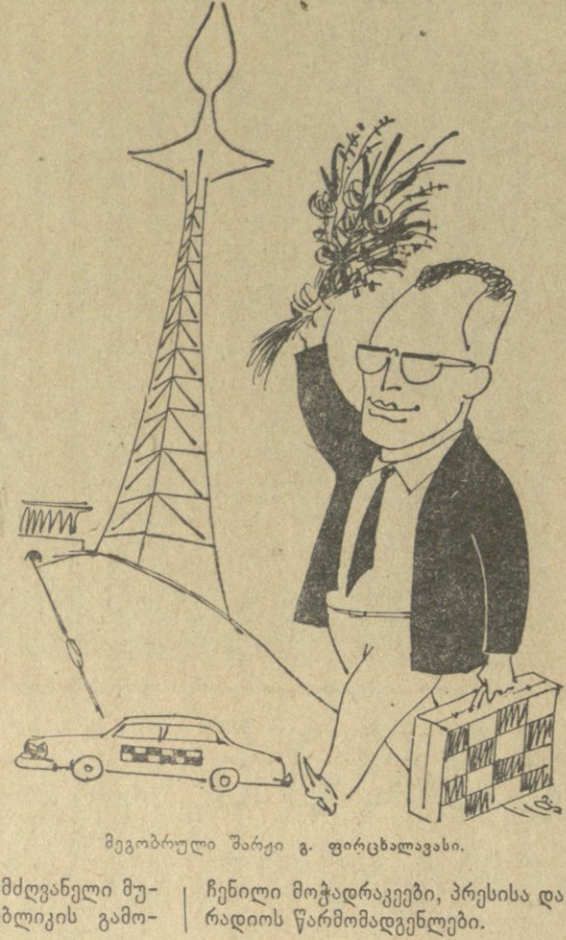
მეგობრული შარტი გ. ფორცხლავასი.

თბილისის ტადრაციის მოყვარული საზოგადოება შეუწყობდა ინტერესით მოვლის მსოფლიოს სატადრაციო გვირგვინის მფლობელის მიხედვით მოტივინკისა და გროსმისტერ სალო ფლორის ლექციებს და ერთდროული თამაშის სტანსებს.