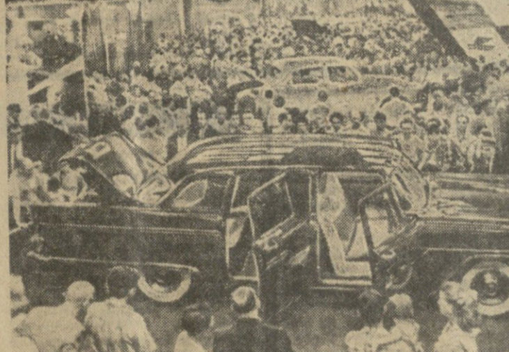
საგარეო საკითხი მინისტრების თათბირი

„არასამშრომლო ცვლილება“. „არასამშრომლო ცვლილება“. „არასამშრომლო ცვლილება“.