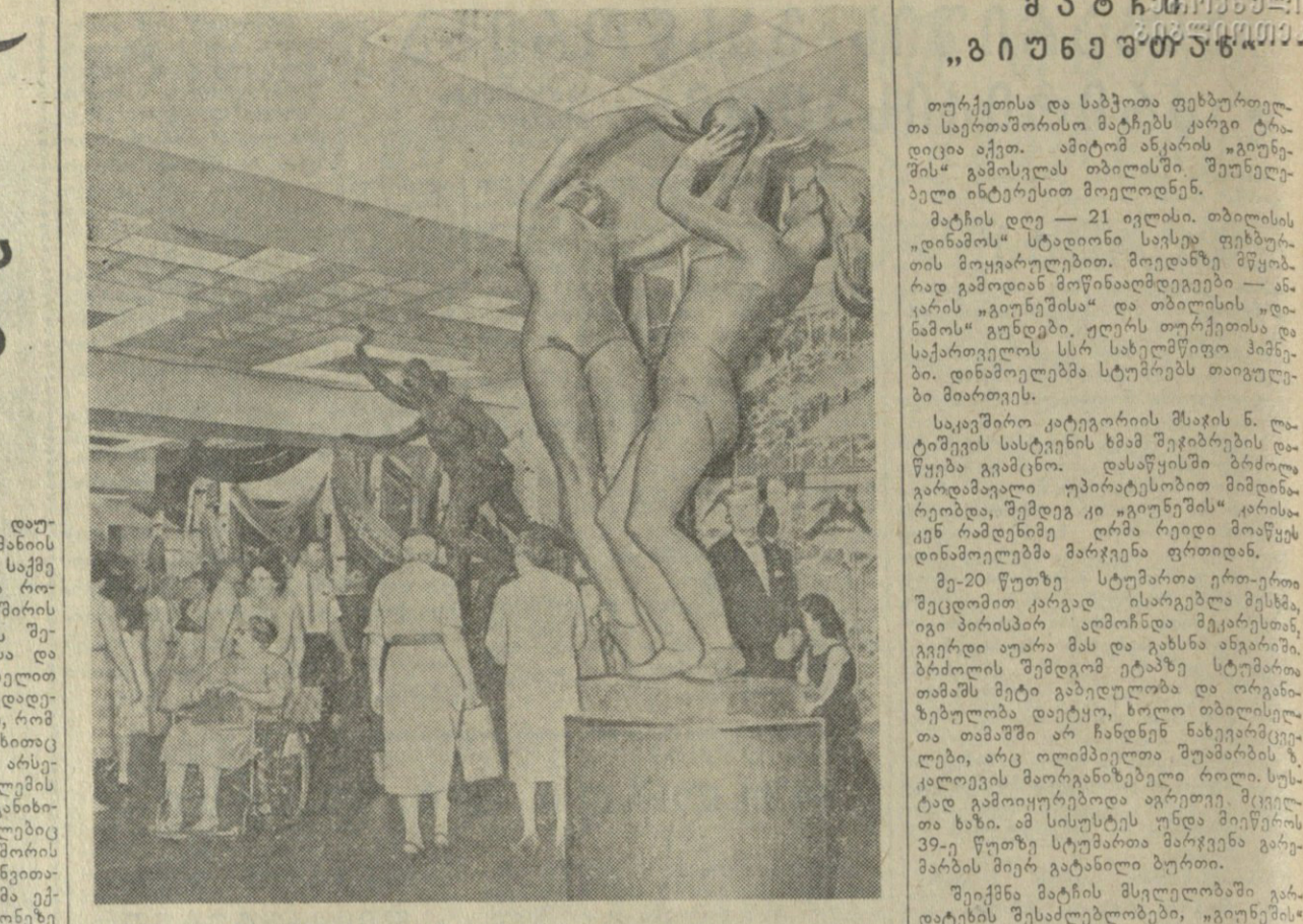
საბოთა გამორბენა ნო-იორკში, სორბის განყოფილება, ფორს საკლასო სტალინი ფორსორბის სტალინი...