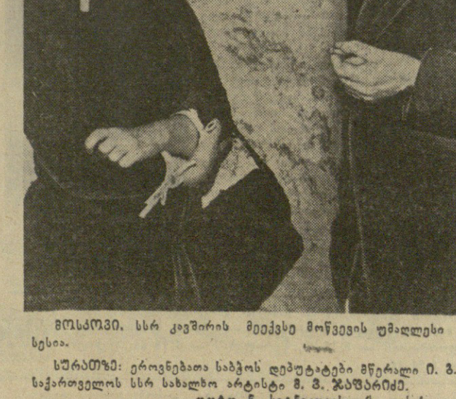
მოსმინი. სსრ კავშირის მეექვსე მოწვევის უმაღლესი საბჭოს პირველი სესიის დასრულების შემდეგ...