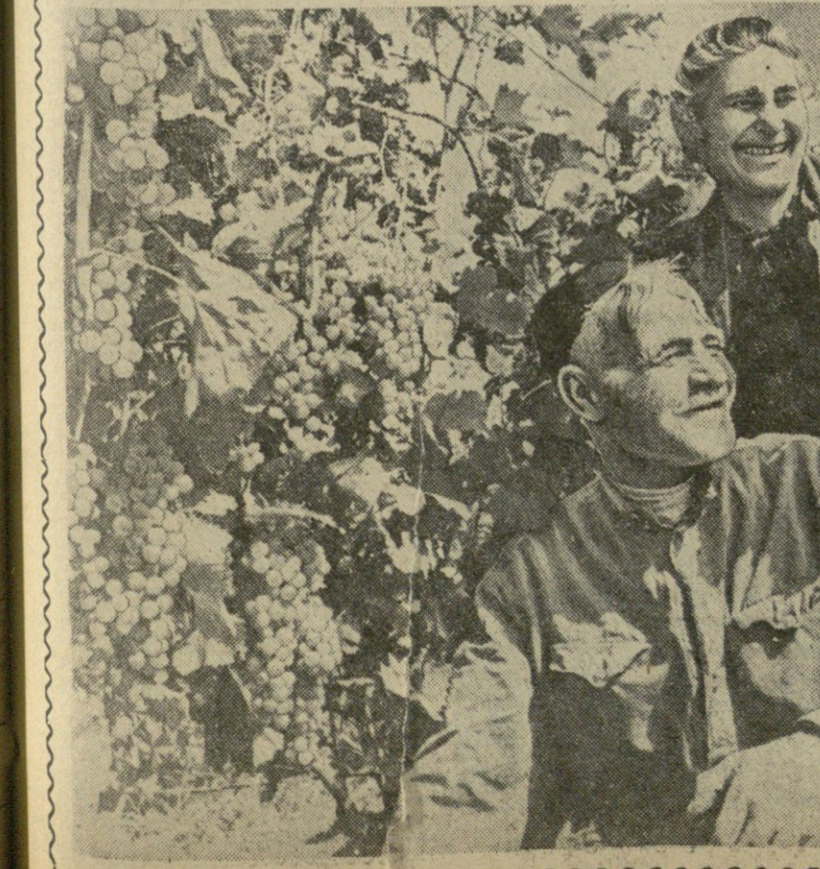
სუფრის მშვენიება.