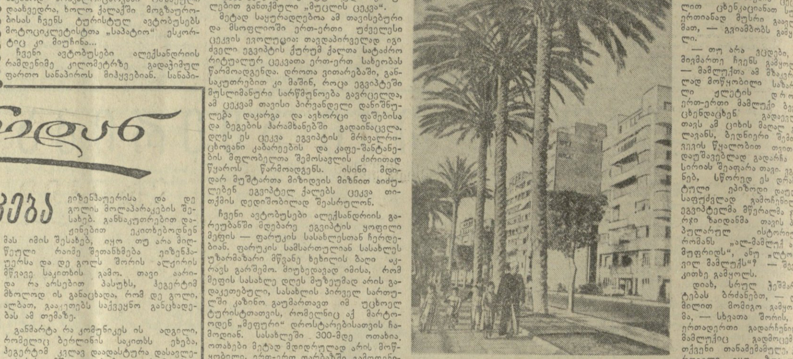
და არც ფოტო ან კინო სურათით არ შეიძლება აღწერა ნილოზის ნაპირების სილამაზეობა.

„ბრანსლვანიტი“ სხილთა ზღვის კვირეულის დასრულება. ნილოზის ნაპირებზე. ნილოზის ნაპირებზე. ნილოზის ნაპირებზე. ნილოზის ნაპირებზე. ნილოზის ნაპირებზე.