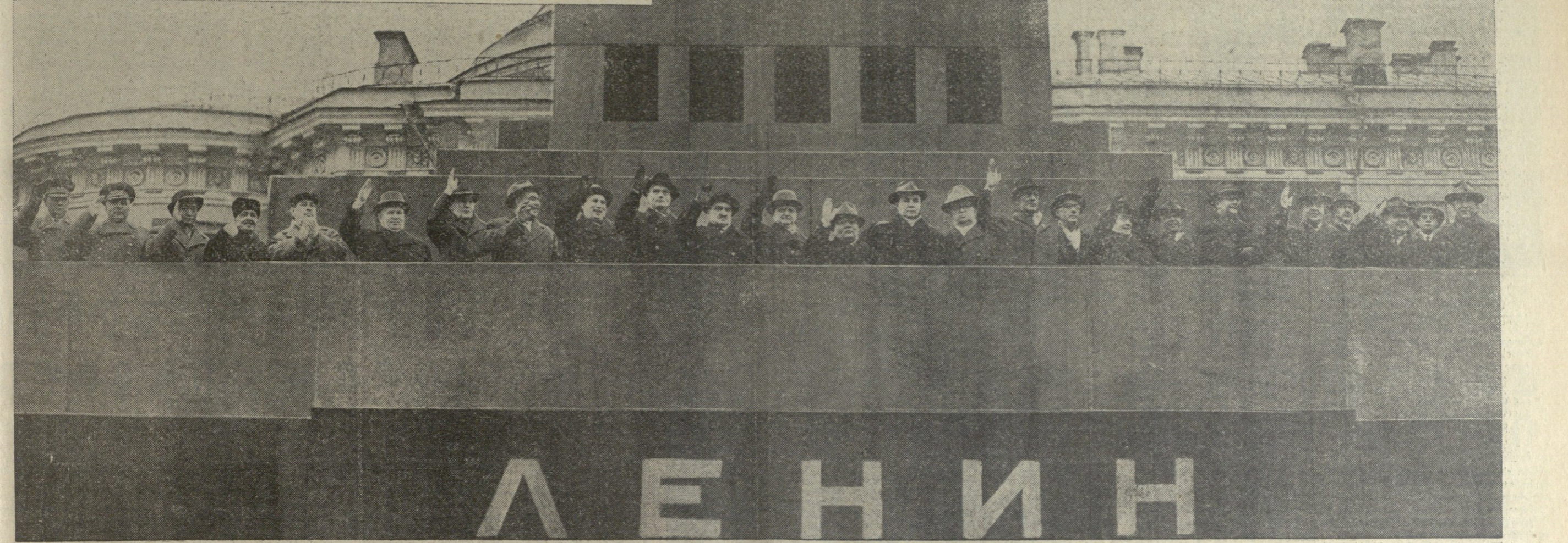
წითელი მოედანი 1961 წლის 7 ნოემბერს. პარტიისა და მთავრობის ხელმძღვანელები, მოძვე კომუნისტური და მუშათა პარტიების წარმომადგენლები ვლადიმერ ილიას-ძე ლენინის მავსოლუმის ტრიბუნაზე.

ბრძანებულა სსრ კავშირის უმაღლესი საბჭოს პრეზიდიუმის სესიის 1961 წლის 6 დეკემბერს ქალაქ მოსკოვში. სსრ კავშირის უმაღლესი საბჭოს პრეზიდიუმის თავმჯდომარე ლ. ბრეჟნევი. სსრ კავშირის უმაღლესი საბჭოს პრეზიდიუმის მდივანი მ. გიორგაძე.