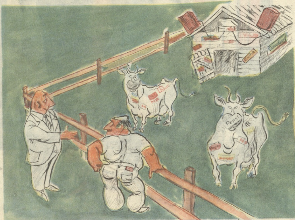
— რას ვბავს ეს?! რატომ ავიჭრალავიანთ საქონელი?! — თქვენ არ გვეუბნებოდით, დროს ჩაშორებით, არაფერი თანაბედროვე არა გაქვთო?!