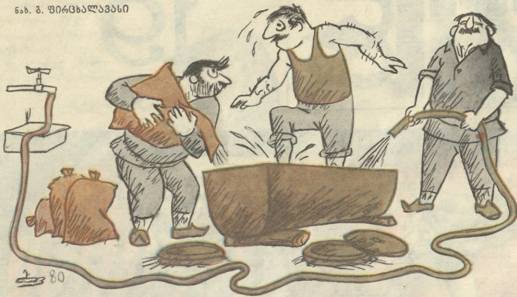
— კახეთში, თურგა, ღვინოს ყურძნიდან აკეთებენ!..