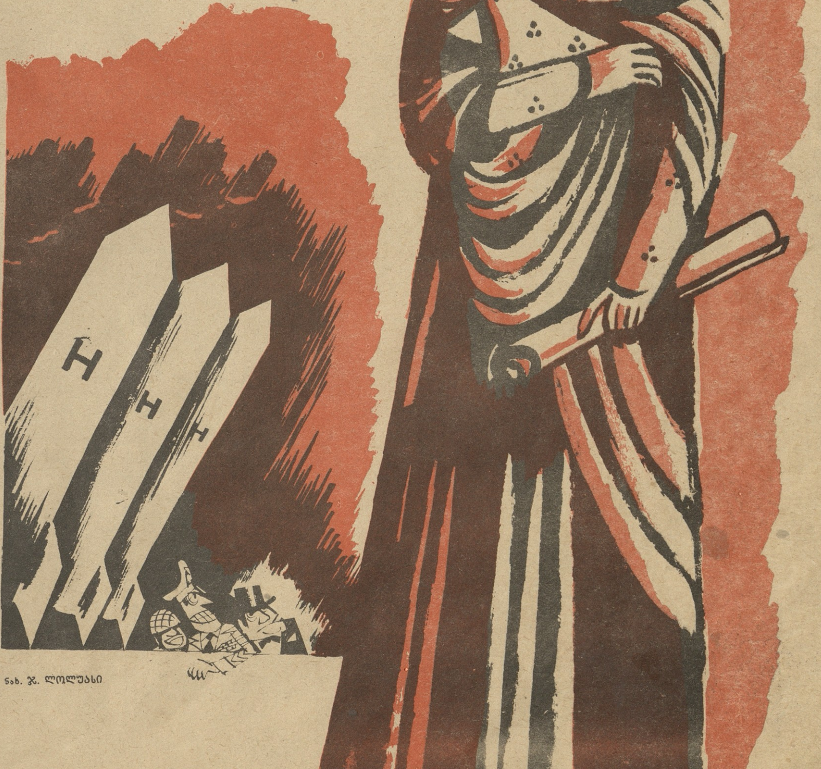
ნახ. ჯ. ლოლუასი