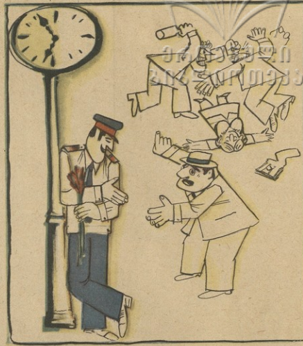
— არაა ჩვენი სამეში არ ჩავერძვი! აკანანვა ვარ მე!