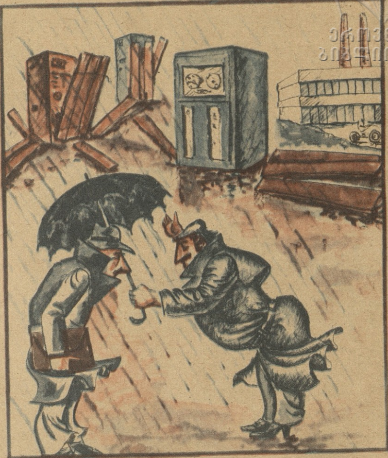
— ჩვენ დიდ ყურადღებას ვუთმობთ ნელაულის მომჭირნელ ხარჯვას. სის მასალას ვზოგავთ და ამ დანადგარების ტარას ვიყენებთ!..