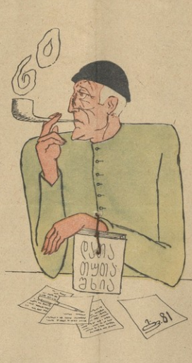
გვიგზობუა შარგი 3. 90698563555

შენ ვიიონი ფრნსუას ლექსის რიტორიკით უნდა თქვა მხოლოდ: «დამინრობ მე ნიგინს ანუ, ან ვიხინი ყელზე დაკიდულ დილბას!»