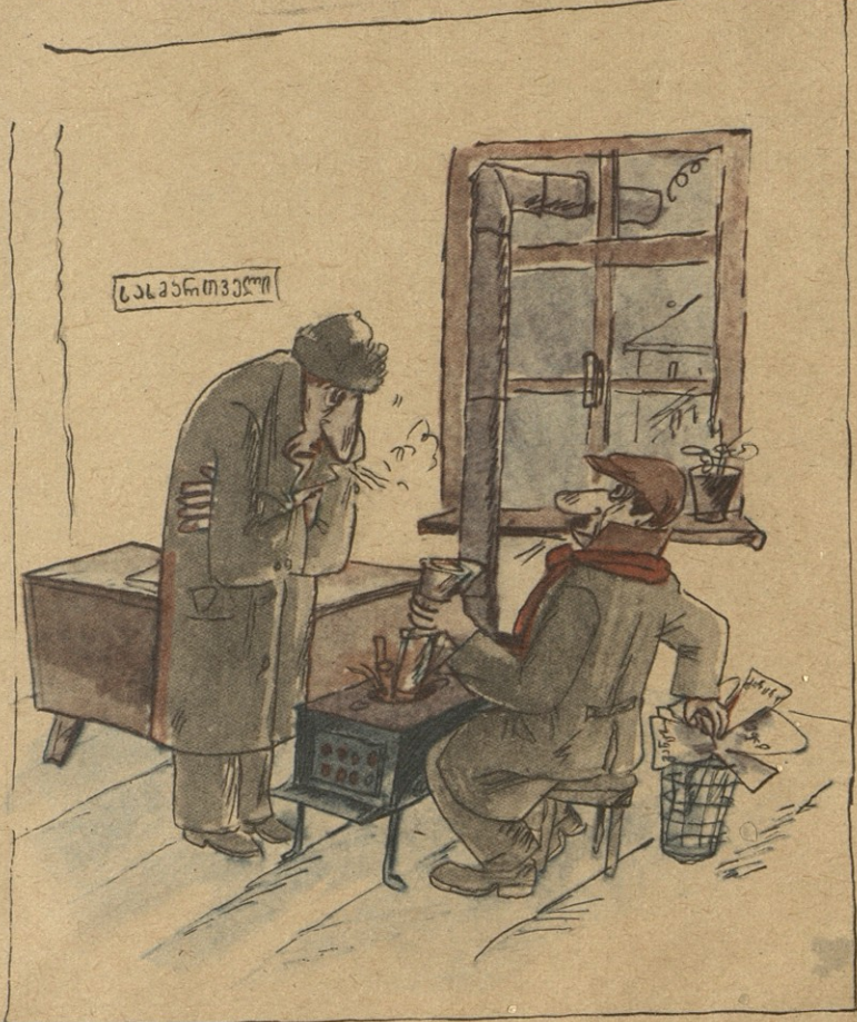
— აცივდა! ანი შებიძლია, გამოიყანო გათბობასთან დაკავშირებული განცხადებები და სარვირები!