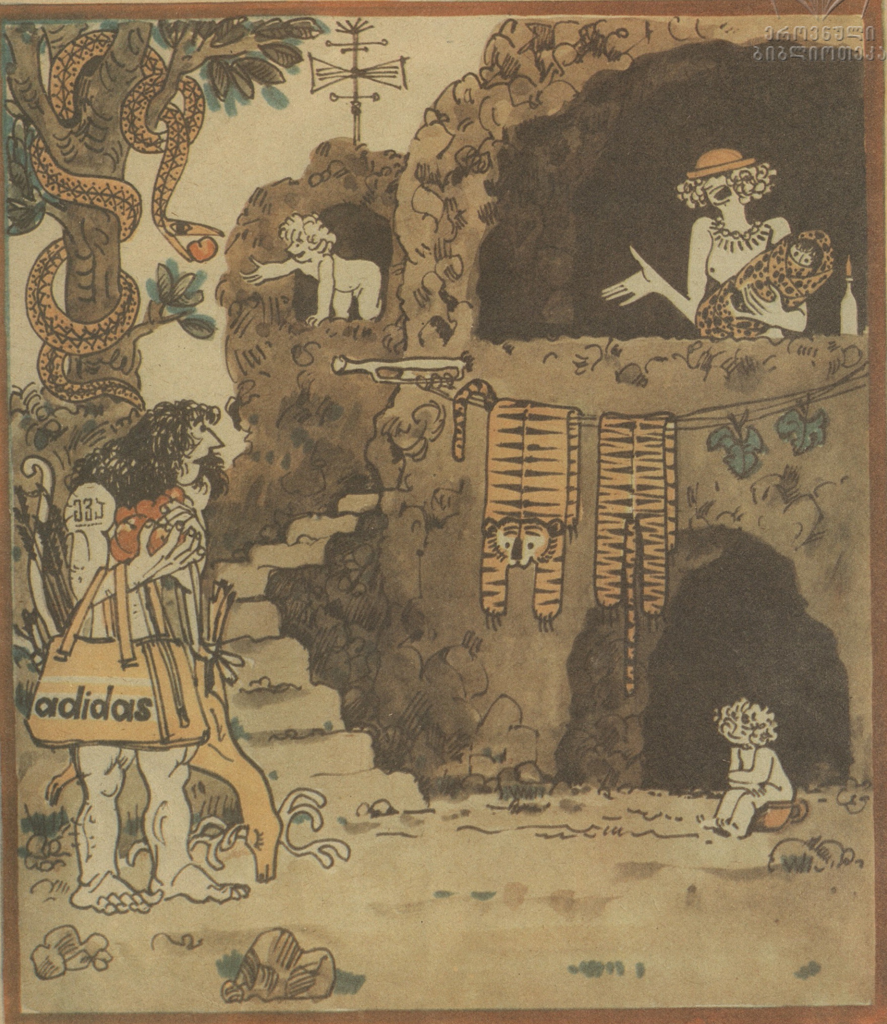
ქვე — ადამს: ლოჯია უნ არ მაღირსა! შიშველ-ტიტველს გვატარებ! დაგვსვი ამ ცარიელ ირმის ხორცზე და გაგიჩინ კიდე შვილებს, მეტი უნ არ გიტყონდა მამაზუციერი!..