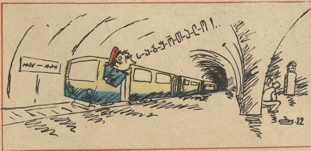
ნ.ბ. ბ. შირცხალაშასი