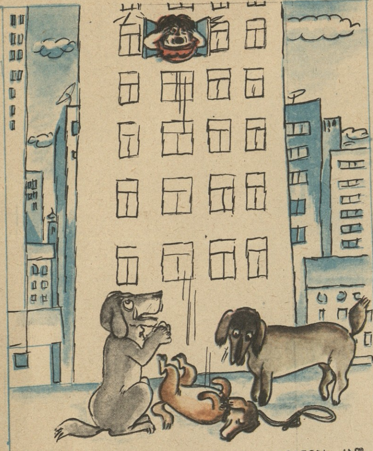
ნახე, გადმოსტა, გამოქცა ადამიანებს, ძალ- ღური ცხოვრება მოენატრა!