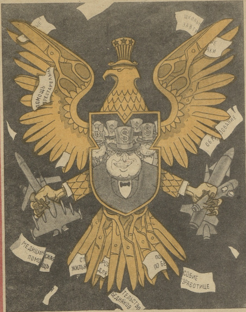
რეიგანეკონომიკა — მოქვედაზაში!