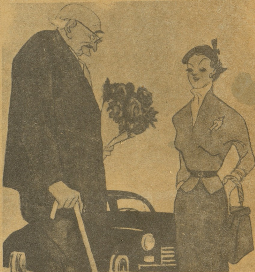
— ლეონკა, არ გინდათ, ჩემი ძვირფასი ბანკოტი?