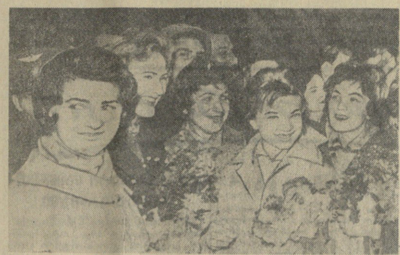
პოლანეთის კულტურის დღეების დასრულებას მსოფლიოში უდიდესი მნიშვნელობა აქვს.

ბა, თანამოღვე დამიდა წინა. მარტო „ოქტომბრის“ ნახვად ღირს წარსულში, როცა ცხენებით და ურბებით მოგზაობებდნენ. უკვეა გზა რომში მიდიდა. ხოლო რაკეტებისა და „სუ-114“-ის ხანა უკვეა გზა მოსკოვზე გადის. ჩვენს ხალხებს ბევრი რამ ავაზიარებს ერთმანეთთან.