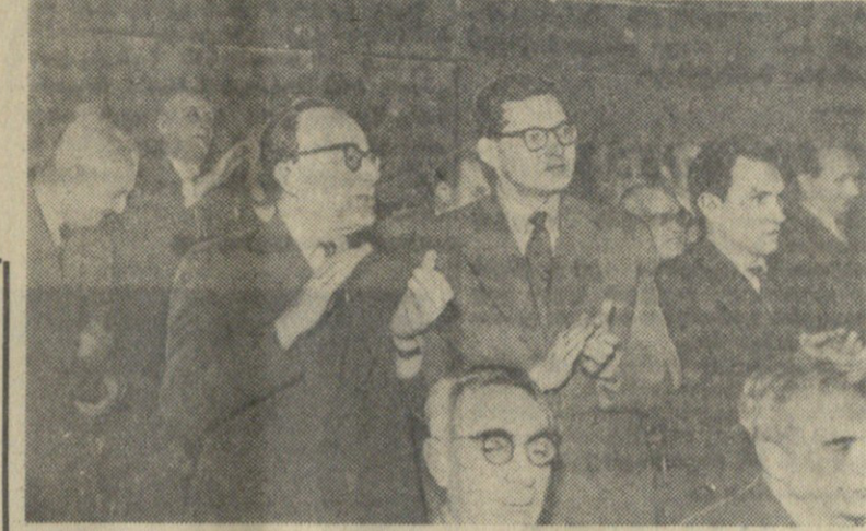
„ჩინებულა“, ამბობენ პოლანეთელი ბალეტ „ოქტომბრე“.