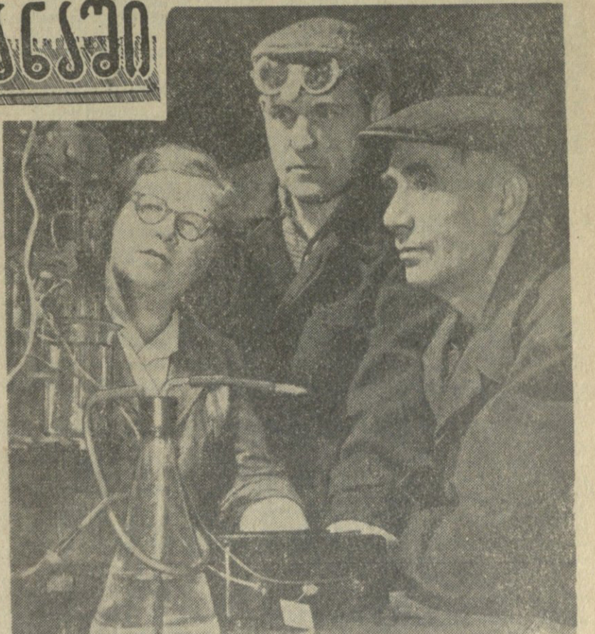
ლენინგრადის კიროვის სახელობის ქარხნის მარტენის სამჭრო მეტალურგები სსრ კავშირის ცენტრალურ ყრილობაში მონაწილეობის მიზნით მოსკოვში. მარჯვნივ: ლენინგრადის კიროვის სახელობის ქარხნის მარტენის სამჭრო მეტალურგები სსრ კავშირის ცენტრალურ ყრილობაში მონაწილეობის მიზნით მოსკოვში.