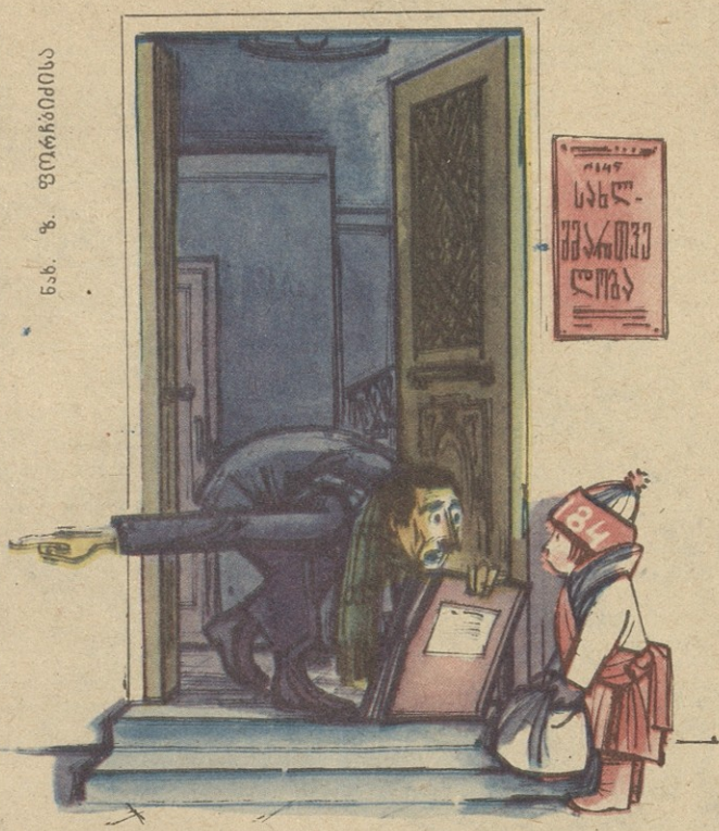
— მაგ ტკბილეულის ნაცვლად სარემონტო მასალები რომ მოგეტანა, მეც ტკბილად გავითენებდი ახალ წელს!