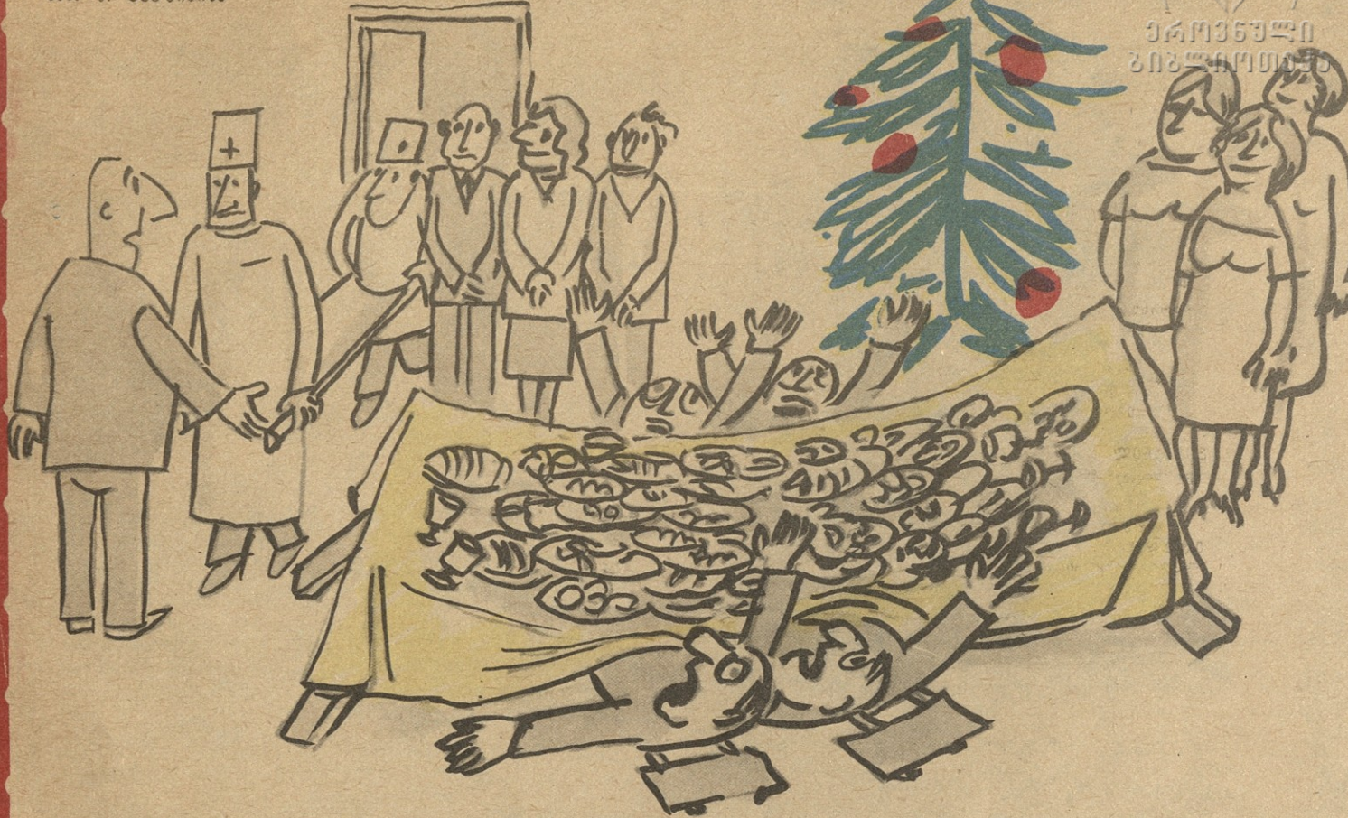
— იჩხუბებს? — არა, მაგიდამ ხორავს ვერ გაუძლო!