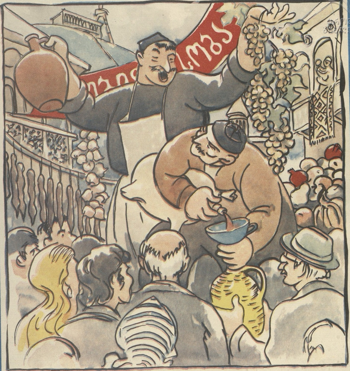
— ახა ჩვენი ფახით თუ ჩამოვუტანეთ თბილისელვს ყველა- ფარი, ესენი სოფალუი ჩამოვსვლელაბილა არინან?!